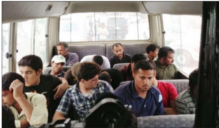
أحداث من بين الموقوفين في حملة الجهراء

كشفت مصادر أمنية أن حصيلة فرز المخالفين الذين تم ضبطهم اول من امس في الحملة الموسعة التي جاءت تحت اشراف وكيل وزارة الداخلية لشؤون الامن الخاص الفريق سليمان الفهد وبمشاركة قطاعات أمنية مختلفة وتحت متابعة ميدانية من مدير امن الفروانية اللواء عبدالفتاح العلي، ومدير أمن الجهراء اللواء ابراهيم الطراح أسفرت عن ابعاد 256 وأفدا بعد ثبوت مخالفتهم لقانون الإقامة والعمل لدى الغير، كما تم تحويل 113 وأفدا إلى مباحث الهجرة لكونهم مطلوبين لها إلى جانب تحويل 7 قصر جميعهم من الجنسية السورية إلى مخفر الفردوس لضبطهم يعملون في مخالفة صريحة لقانون العمل باعتبارهم غير بالغين، كما أحيل 95 وأفدا إلى مخافر مطلوبين لها على ذمة قضايا، وعلى هامش الحملة والتي بلغت محلقتها النهائية قبيل الفرز 519 وأفدا، وتم ضبط 5 سيارات مطلوبة، وكشف اصحابها عن أن إجمالي من ثبتت صلاحية إقامتهم في البلاد هم 48 وأفدا أطلق سراحهم بعد أن تقدم كفلاءهم بأوراقهم الثبوتية.