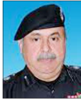
الفريق سليمان الفهد