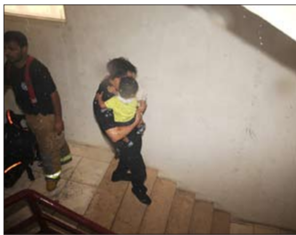
.. واحد رجال الاطفاء يحمل طفلا بعد انقائه من الدخان