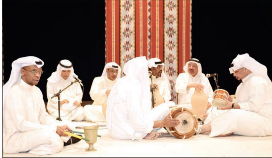
فرقة معيوف مجلي وفنونها التراثية

وأشار الخميس إلى قسم الإعلام الذي يعتبر تطوره تطوراً للبشرية إضافة إلى تاريخ الإعلام والصحافة، متناولاً أساسياتها وأنواعها وصفاتها منها الصور والمنبر القيادي والتأثير على الرأي العام والمهارات والمغامرة واجتياز الأزمات والمنافسة، مشيراً إلى أن التنمية الإعلامية تلعب دوراً بارزاً وأساسياً في تنمية الإعلاميين والمؤسسات الإعلامية التي اعتبرها مفقودة في الكويت والعالم العربي، مبيناً أن المفترض تنمية الذات بالنسبة للقيادي، معتبراً أن هناك 67% من الإعلاميين لا يجيدون التعامل مع التكنولوجيا. وأضاف أن الإعلام بيده القدرة لتحقيق التنمية بشكل أساسي في التنمية الاجتماعية والسياسية والاقتصادية إلى جانب دور الإعلام في التوجيه ووسائل الاتصال الحديثة باستخدام التوعية وحفظ حقوق الملكية الفكرية.