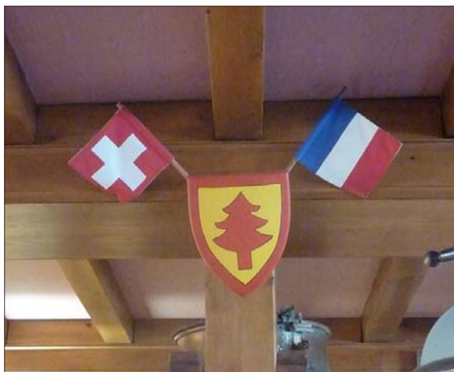
الفندق من الداخل بين بلدين