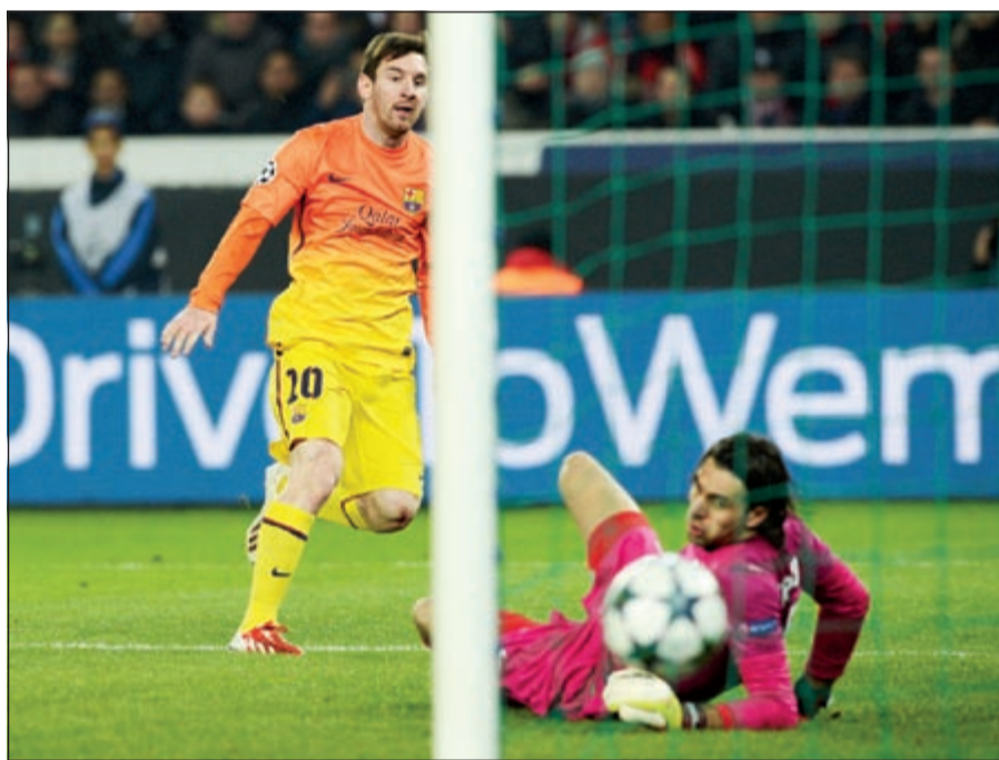
ميسي سجل هدف برشلونة الأول قبل خروجه مصابا

وتقدم برشلونة مرتين عبر الأرجنتيني ليونيل ميسي (38) وتشافي هرنانديز (89) من ركلة جزاء، ورد باريس سان جرمان مرتين بواسطة لاعب برشلونة السابق الدولي السويدي زلاتان إبراهيموفيتش (79) وماتويدي (4+90). وبلغت الفريقان إيابا الإربعاء المقبل على ملعب كامب نو في برشلونة. وقدم ماتويدي خدمة جليلة لفريقه وأبقى أماله في التأهل قائمة ولو أنها صعبة خصوصا ان الفريق الكاتالوني صعب المراس على أرضه وبات قريبا من بلوغ دور الربعة بحكم انه يحتاج إلى تعادل سلبي او 1-1. وكفر ماتويدي عن الخطأ الذي ارتكبه ونال على اثره انذارا سيغيب بسببه عن مباراة الإياب وسجل هدفا قاتلا في الوقت القاتل. وفاجأ مدرب باريس سان جرمان الإيطالي كارلو أنشيلوتي الجميع بإشراكه النجم الإنجليزي ديفيد بيكام (37 عاما) أساسيا