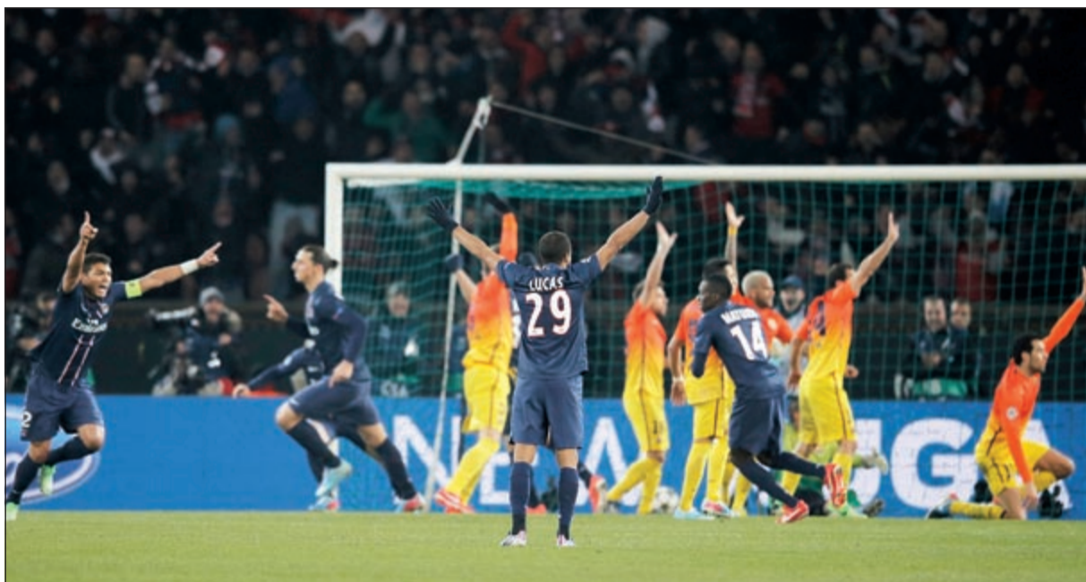
فرحة إبراهيموفيتش وسيلفا وماتويدي بهدف التعادل الأول لسان جرمان وسط اعتراضات لاعبي برشلونة