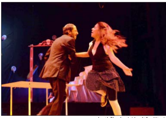
الأستاذ والتلميذة في لحظة اندماج

فلا بد أن يحمل العرض في طيه السمة العامة للعبث فشكلت السينوغرافيا حالة من الفوضى والربح والوحشية وطغى السواد خشبة المسرح واستعان المخرج الشاب رامي نادر بإضاءة حمراء عكست الأبعاد النفسية للشخصيات التي تمثلت في حالة الربح في التلميذة وحالة الحب في الخادمة.