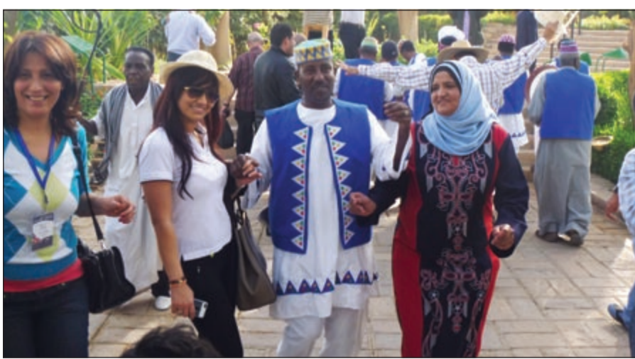
استقبال نوبي خاص للإعلاميين العرب

وتابع السيد متحدثاً عن مجالات الاستثمار والتطوير التي شهدتها أسوان وما تقدمه من امتيازات للمستثمرين العرب، خاصة من الكويت، حيث