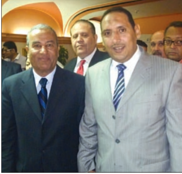
الزميل اسامة أبو السعود مع محافظ اسوان مصطفى السيد