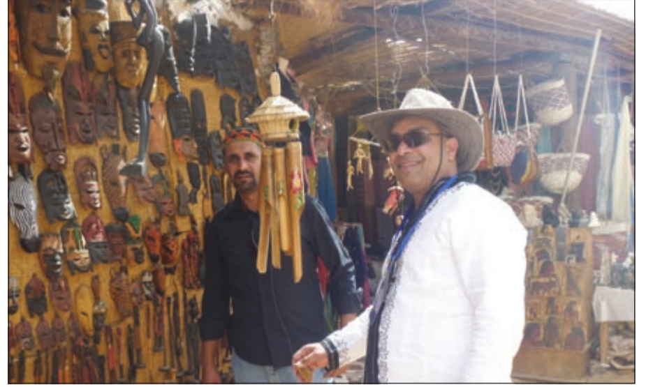
زعماء إعلاميون في قرية النوبة

تشمل مخططاً لإنشاء قرى سياحية كثيرة في البر الغربي على مساحة 4500 فدان