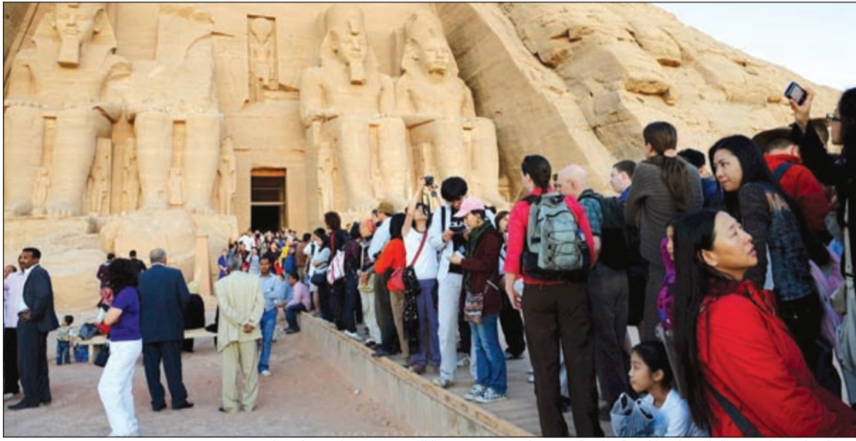
آلاف السياح من كل دول العالم توافدوا لرؤية تعامد الشمس على وجه رمسيس الثاني يوم 21 فبراير من كل عام