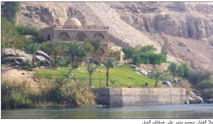
فيلما الفنان محمد منير على ضفاف النيل