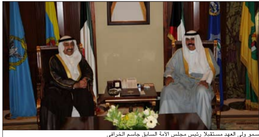
سمو ولي العهد مستقبلاً رئيس مجلس الأمة السابق جاسم الخرافي

استقبل سمو ولي العهد الشيخ نواف الاحمد بقصر بيان صباح امس رئيس مجلس الأمة السابق جاسم الخرافي. كما استقبل سمو ولي العهد الشيخ نواف الاحمد بقصر بيان صباح امس سمو رئيس مجلس الوزراء الشيخ جابر المبارك.