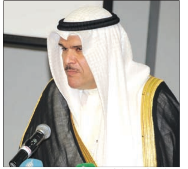
وزير الإعلام الشيخ سلمان الحمود متحدثا في الافتتاح

أكد أنه إن لم نحافظ على تراثنا فلا مستقبل لنا