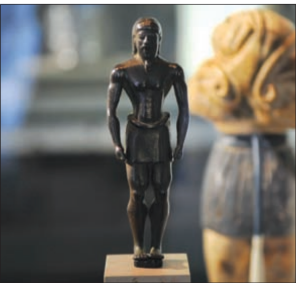
من مقتنيات المعرض

برعاية سامية من صاحب السمو الأمير الشيخ صباح الاحمد، دشنت دار الآثار الإسلامية افتتاح معارضها الأربعة بحضور الشيخ ناصر صباح الاحمد وزير شؤون الديوان الأميري، ووزير الإعلام وزير شؤون الشباب الشيخ سلمان الحمود، ووزير الثقافة والإرشاد الإسلامي لجمهورية إيران الإسلامية د. سيد محمد حسيني ووزيرة الثقافة في مملكة البحرين الشيخة مي الخليفة والسيدة الأولى في جمهورية المالديف. بدأ حفل الافتتاح بكلمة من رئيس اللجنة التأسيسية لدار الآثار الإسلامية بدر البعيجان الذي رحب بالحضور ومشاركة الدول الشقيقة والصديقة التي قدمت تحفا من تراثها الفني القديم لدار الآثار ضمن مشاركة أربع دول، وأشار البعيجان إلى ما تحويه هذه المعارض الأربعة من معنى لمد جسور الثقافة بين الكويت والعالم. وقال إن هذه السلسلة من المعارض تنطلق بهدف تواكب الاهتمام بتنوع مشارب الثقافات الإنسانية والشيخة حصة صباح السالم الصباح المشرف العام للدار تذكرنا دائما بأن المجموعة الفنية لمجموعة