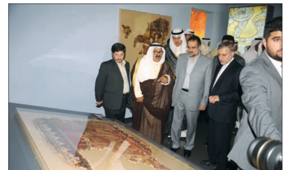
الشيخ ناصر صباح الاحمد يطلع مع الحضور على أحد مقتنيات الدار