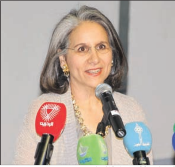
الشيخة حصة الصباح ملقبة كلمتها