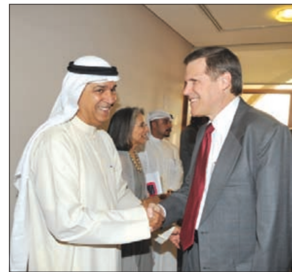
السفير الأمريكي ماثيو تولر مصافحا م. علي اليوحة