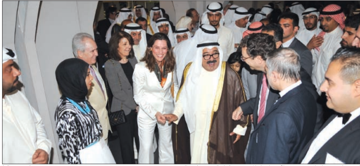
الشيخ ناصر صباح الاحمد في جولة في ارجاء المعرض مع كبار الشخصيات والحضور (سعود سالم)