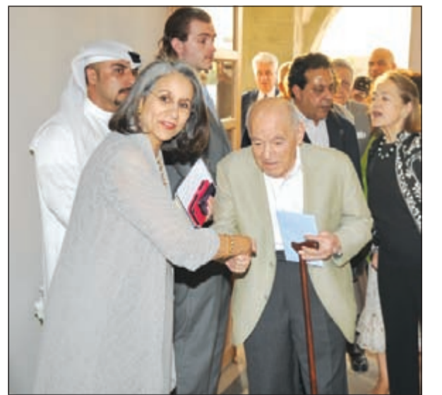
الشيخة حصة الصباح في استقبال الضيوف