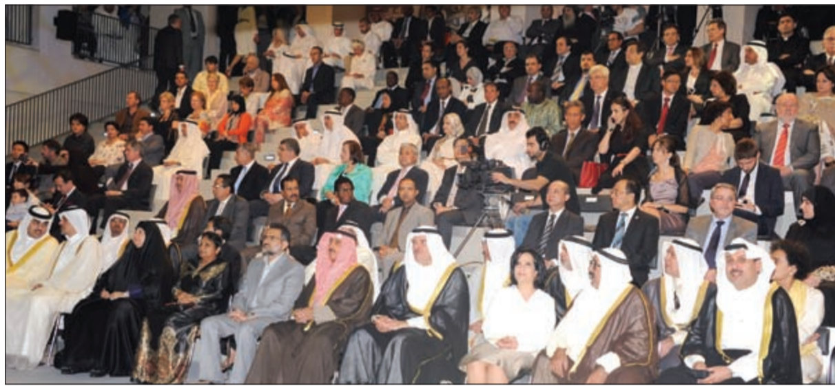
حضور كبير يتقدمهم الشيخ ناصر صباح الاحمد والشيخ سلمان الحمود ود. ابراهيم الدعيج