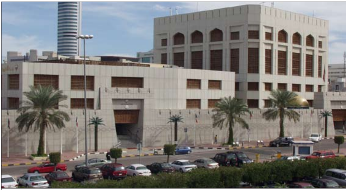
ارتفاع ملحوظ في عرض النقد