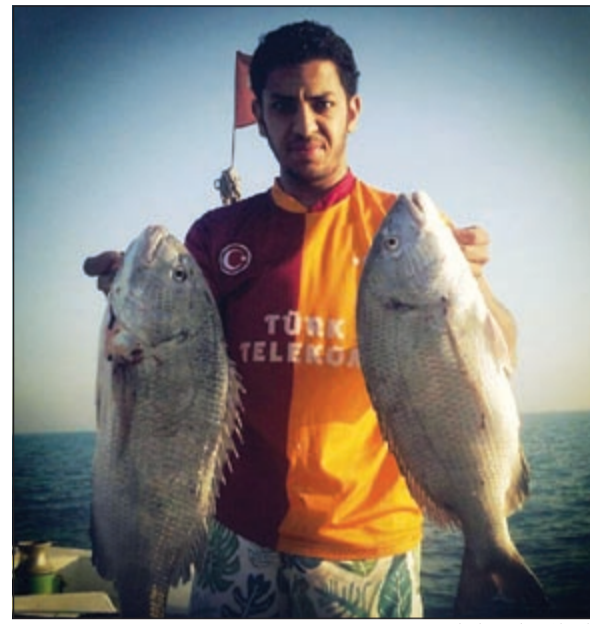
يا سلام عليك يا ولد