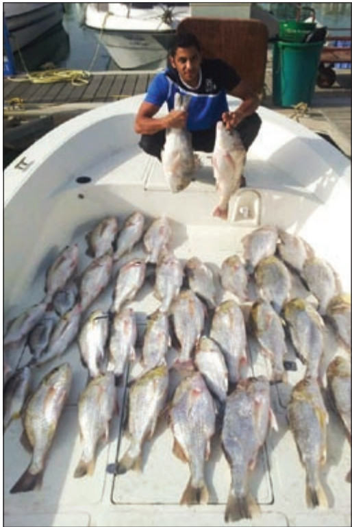
رحلة الاثنين 1 أبريل 2013

«بحري» صفحة تستقبلكم كل أربعاء بكل ما يعني بالبحر وهواية الحدائق أسبوعياً نسلط الضوء على هذه الهواية، ونستقبل مشاركاتكم وصوركم وآراءكم. للتواصل معنا عبر هذه الصفحة أرسلوا تعليقاتكم على الايميل: bahri@alanba.com.kw ● اعداد: هادي العنزي