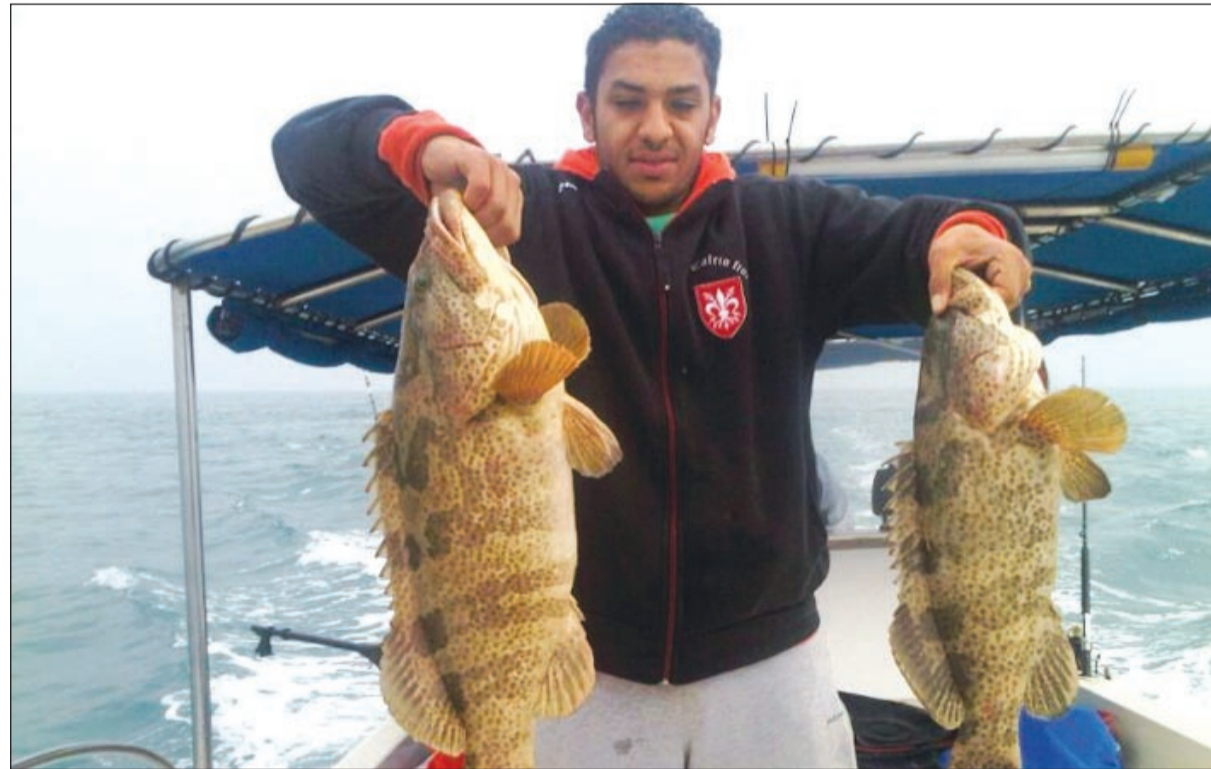
وأحلى جذاعة وعيش حياتك

● شوف كل أنواع الأسماك تحتاج إلى شيء مهم حتى يصل الشخص إلى معرفة الأوقات والأماكن المناسبة لصيدها ولا يأتي ذلك إلا من خلال الخبرة والممارسة الفعلية للصيد وقد تعبت كثيراً حتى وصلت بالخبرة إلى ما أنا عليه اليوم وبالنسبة لسمكة الشماهي فهي من الأسماك الونيصة بالصيد وذات الطعم الممتاز وصيدها يكون صيفاً بين قنار عوثة والشيب وأفضل أوقات صيدها يكون قبل الغروب والليمة ميده كاملة وتحديداً في شهر يونيو ولغاية شهر سبتمبر، أما بالنسبة ملك المائدة الهامور فهو موجود على مدار السنة وهو متوافر في أغلب المحاقق وأفضل مكان لتواجده يكون بعوثة وأكثر الأوقات التي يكثر فيها صيد الهامور يكون عند انتهاء موسم الخفاق وتحديداً من منتصف مايو لغاية نوفمبر والشعم من الأسماك المرغوبة لدى