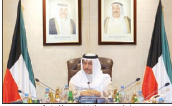
سمو رئيس الوزراء الشيخ جابر المبارك مترئسا للجلسة