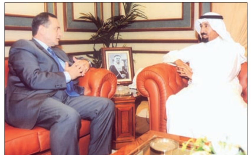
محافظ العاصمة الشيخ علي الجابر خلال لقائه السفير الأردني د.محمد الكايد

ورحب الجابر بالسفير الضيف وتبادل معه الأحاديث الودية التي تناولت العلاقات الثنائية بين البلدين الشقيقين وسبل الارتقاء بها وتعزيزها في المجالات كافة.