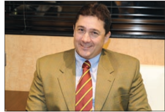
السفير التركي صالح مراد تامير

استقبال رئيس التحرير الزميل يوسف خالد المرزوق السفير التركي لدى الكويت صالح مراد تامير، حيث تناول اللقاء الشؤون الإعلامية المشتركة وسبل تدعيمها، وكذلك اجواء التعاون الإعلامي بين الكويت وتركيا. حضر اللقاء نائب رئيس التحرير الزميل عدنان الراشد.