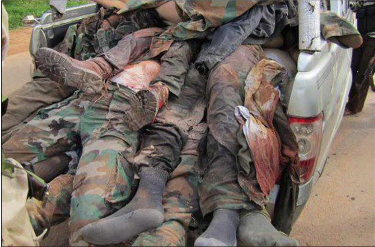
صورة بثها ناشطون لجيش قوات النظام سقطت في معارك مع الجيش الحر في كنفريا والقوعة بريف ادلب

عواصم - وكالات - مع امتداد الاشتباكات العنيفة الى محيط سوق الهال قرب منطقة الزبلطاني في دمشق، توقع مصدر عسكري نظامي نشوب معركة ضخمة على أطراف العاصمة قريبا في حين استمرت عمليات القصف العشوائي لقوات النظام على معظم احياء حمص المحاصرة ومناطق شمال سورية الخارجة عن سيطرتها وكذلك المنطقة الشرقية ودرعا.