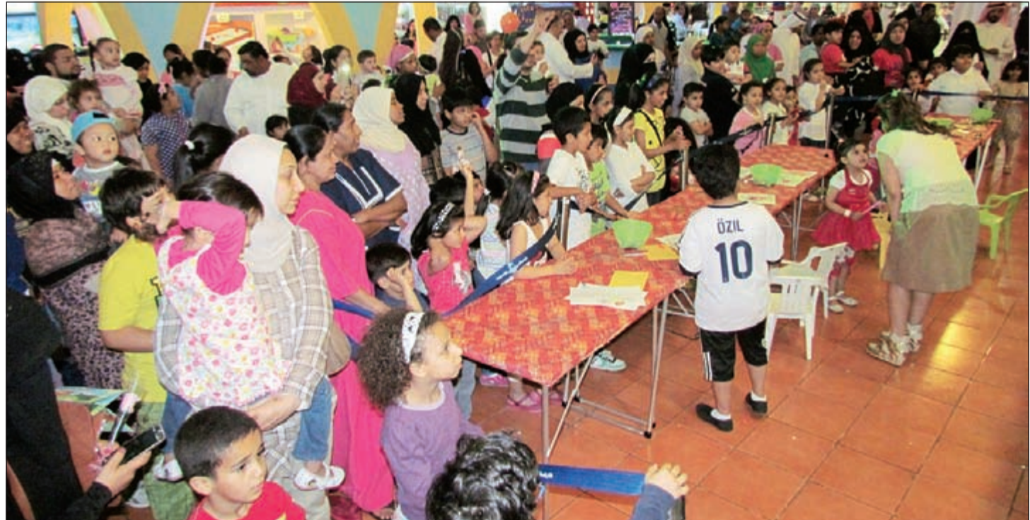
حضور أسري كبير في مهرجان الأسرة لـ «طفل المستقبل»

العظيم الذي تلعبه الأم في خدمة المجتمع، وكذلك في تربية الأجيال المقبلة التي من شأنها أن تساهم في رقي وتطور وبناء مجتمع، ووطن نفخر به جميعا. وأضاف جاء من خلال الاحتفال جاء من خلال تنظيم العديد من البرامج والأنشطة المتميزة بمشاركة الشخصيات الكارتونية المحببة للأطفال وتوزيع الهدايا القيمة على الأمهات وأطفالهن. وفي السياق ذاته أوضحت مبروك أن الشركة تدرك تماما أن المسؤولية