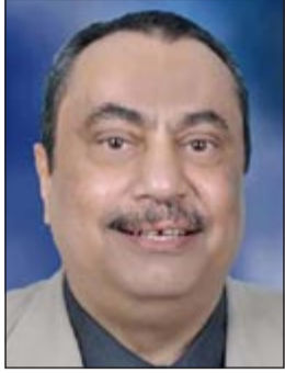
د. خالد السهلاوي

أعلن وكيل وزارة الصحة د. خالد السهلاوي عن انطلاق أنشطة مؤتمر الكويت الأول للطوارئ الطبية وإدارة الكوارث خلال الفترة من 15 إلى 17 الجاري. وقال د. السهلاوي في تصريح صحفي له أن المؤتمر يهدف إلى تطوير خدمات الطوارئ الطبية في انفاذ الحياة لتقديم أفضل رعاية طبية للمرضى والمصابين بالإضافة إلى تعزيز سبل التعاون بين الجهات المعنية بالدولة والمنتملة في جهاز الأمن الوطني ووزارتي الداخلية والدفاع، بالإضافة إلى الهيئة العامة للمعلومات المدنية وادارات الدولة الأخرى وذلك في الحوادث والأزمات الكبرى، مشيراً إلى أهمية