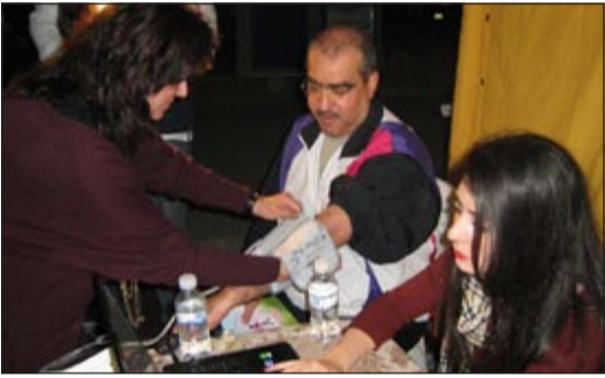
فحص أحد المشاركين في برنامج «كان في مشرف»

المقيم حيث يتم استقبال رواد المشي وعمل «قياسات للوزن والطول وضغط الدم ونسبة السكر» قبل ممارسة المشي وبعد الانتهاء من ممارسة رياضة المشي ويتم