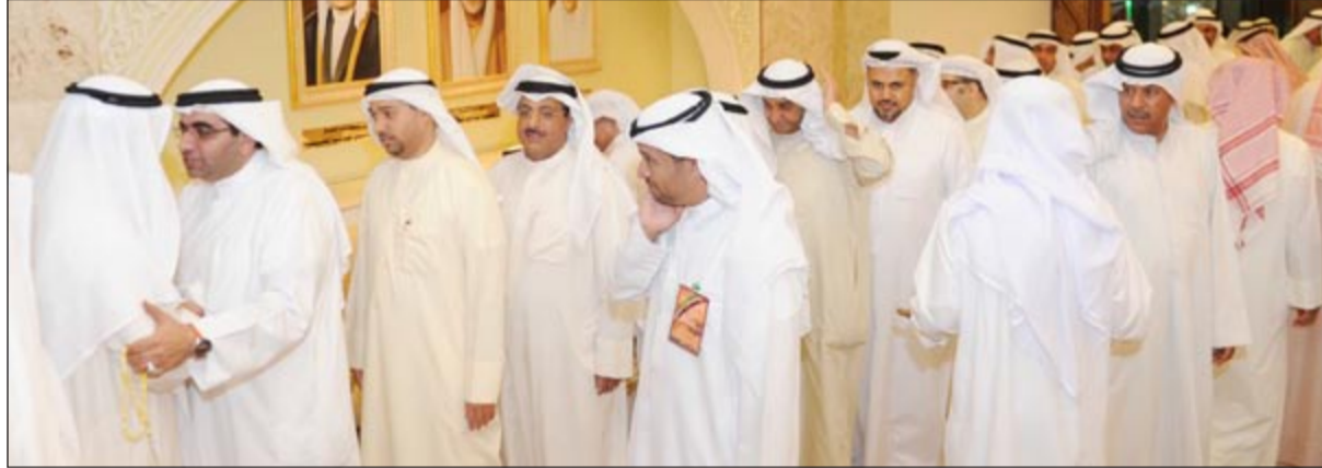
مباركون في ديوان القطان

أكد وكيل وزارة المواصلات م.حميد القطان أن قانون هيئة النقل والسكك الحديدية وقانون هيئة الاتصالات معروضان على مجلس الأمة. مؤكداً أن الوزارة في انتظار التوصيات في هذا الشأن من أجل العمل على متابعة العمل بهما حسب المصلحة العامة. وأشار م.القطان خلال استقباله المهنيين بديوان القطان بمنطقة المنصورية بمناسبة توليته منصب وكيل وزارة المواصلات إلى أن الوزارة ستستعمل على تشغيل نقل الأرقام التجريبي في منتصف هذا الشهر، مشيراً إلى أن نقل الأرقام الكلي سيكون في مطلع شهر مايو بين شركات الاتصالات الثلاث تحت إشراف وزارة المواصلات وشركة فنية تنفذ العملية. وأضاف م.القطان أن الوزارة ستطبق نظام الفايبر