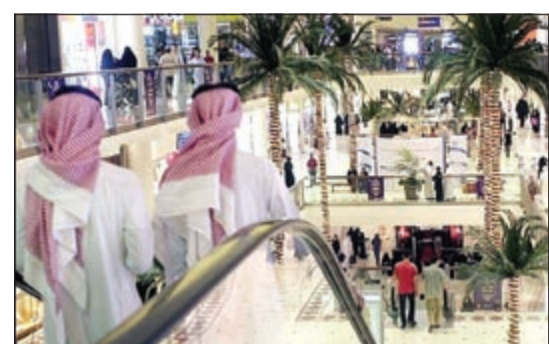
أحد المجمعات التجارية في السعودية

الرياض - العربية: أشارت تقرير دولي أعدته مؤسسة «يوروبونيتور إنترناشونال» البريطانية إلى أن عدد سكان السعودية سيصل بحلول العام 2030 إلى 38,5 مليون نسمة، بزيادة نسبتها 34,1٪ عن تعداد العام 2012. وتوقع التقرير، الذي نشرته «الحياة»، أن يشهد عدد كبار السن - من سن 65