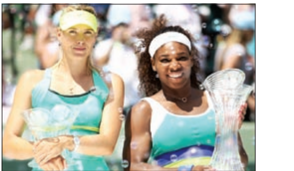
سيرينا وليامز وماريا شارابوفا بطلة ووصيفة بطولة ميامي

عادت لاعبة التنس الأمريكية سيرينا وليامز الرقم القياسي لعدد مرات الفوز بلقب لست مرات وتوجت بلقبها السادس في بطولة ميامي للأساتذة اثر تغلبها على الروسية ماريا شارابوفا 4/6 و 6/3 و 6/0 اول من امس في المباراة النهائية للبطولة. واصبحت سيرينا اول لاعبة تحرز لقب بطولة ست مرات بعد كل من كريس إيفرت وشيفي جراف ومارتينا نافراتيلوفا. وافاقت سيرينا بعد سقوطها في المجموعة الأولى من المباراة لتلقب بنتيجة لصالحها في المجموعتين الثانية والثالثة الفاصلة أمام شارابوفا التي وصلت للنهائي بعدما فازت بلقب بطولة إنديان ويلز مؤخراً وحقت الفوز في 11 مباراة متتالية دون أن تخسر أي مجموعة في هذه المباريات. وأوقفت سيرينا انطلاقاً شارابوفا الرائعة وحقت الفوز للمرة الحادية عشرة على التوالي في مواجهة لاعبة الروسية التي لم تغلب على سيرينا منذ 2004. وقالت وليامز «ماريا دفعتني بالفعل، اتطلع بالفعل لمبارتنا القادمة، أشعر بأنني على ما يرام الآن بعدما حققت اللقب للمرة السادسة». وحقت سيرينا المصنفة الأولى للبطولة الفوز الحادي والستين لها في 86 مباراة خاضتها في مشاركتها ببطولة ميامي. وقالت شارابوفا المصنفة الثانية للبطولة «أشعر بخيبة الأمل ولكنني قدمت شهراً رائعاً في عالم التنس، سيرينا قدمت مباراة رائعة». وكانت رغبة شارابوفا هي أن تصبح ثالثة لاعبة تجمع بين لقبين إنديان ويلز وميامي في العام نفسه ولكنها تراجعت في وسط المجموعة الثانية لتبدأ رحلتها نحو الهزيمة في النهائي.