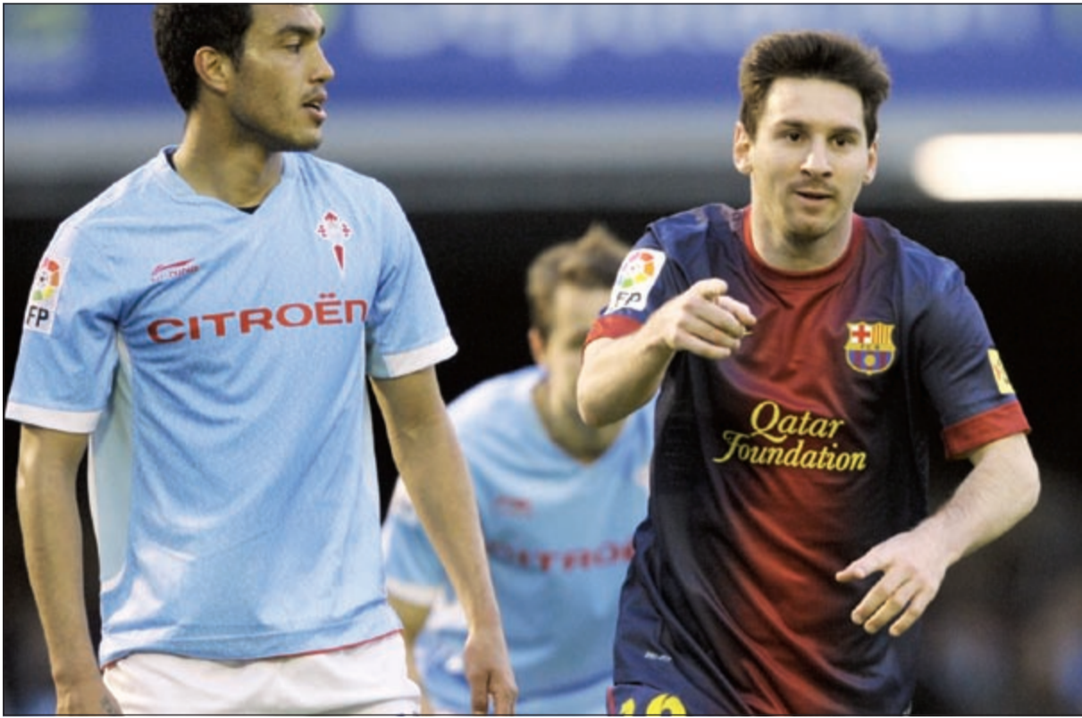
نجم برشلونة ليونيل ميسي يحتفل بهدفه في مرمى سلتا فيغو