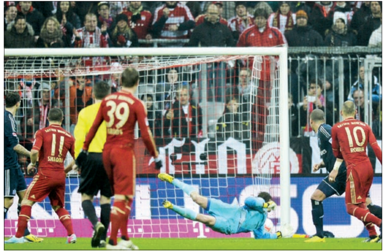
مهاجم بايرن ميونخ آرين روبين يسجل الهدف الرابع لفريقه في مرمى هامبورغ