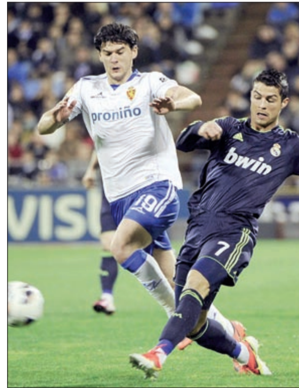
رونالدو قاد الملكي للتعادل مع ريال سرقسطة