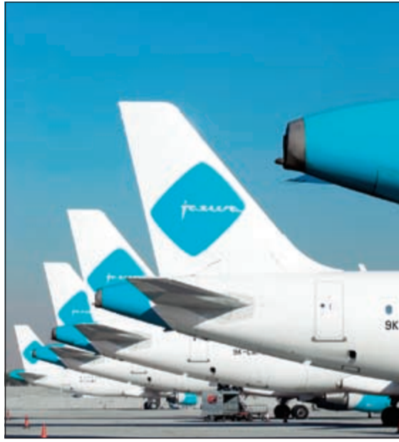
طائرات «طيران الجزيرة»

التي تقدم خدمة الإنترنت المنزلي لمدة سنة قابلة للتجديد وبسرعة 2Mbps مجاناً بلا حدود ودون أي تكاليف أو أي قيود. وضمن إطار الحملة التوعوية والتسويقية لمشروع «علم نت»، وذلك بالتعاون مع شركة كواليتي نت المزود الحصري للخدمة، سيتواجد بوث علم نت في كلية العلوم بجامعة الكويت