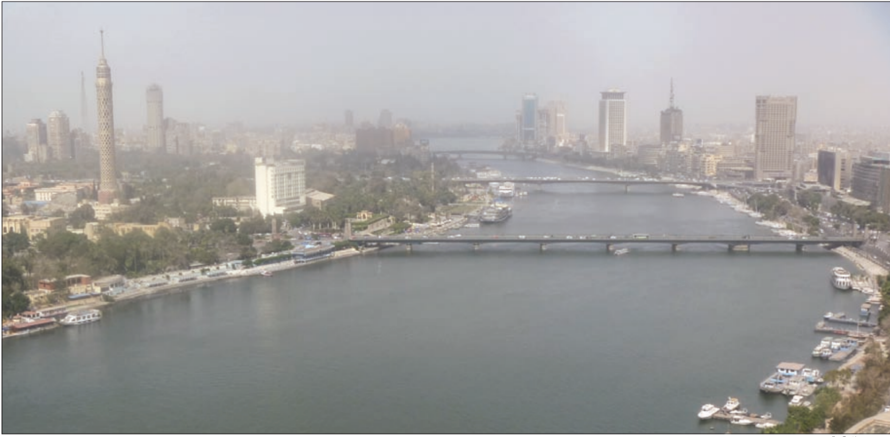
مصر تستظل أمانة