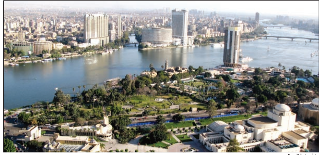
ما أجمل القاهرة

بمشاركة إعلاميين من 17 دولة عربية و«الأنباء» تفوز بجائزة أفضل صحفي متخصص في الإعلام السياحي