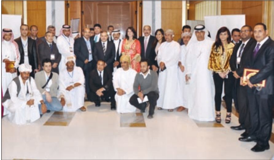
وزير الإعلام صلاح عبدالمقصود في لقطة تذكارية مع الاعلاميين العرب

الوضع في مصر هو محض «افتراء». وقال انه ومنذ الثورة حتى الآن لم يتعرض أي سائح في مصر لأي نوع من الاعتداء وهو دليل واضح