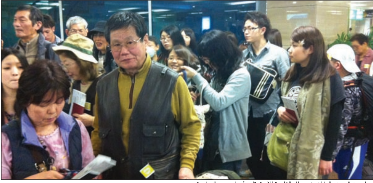
سياح من الصين واليابان في مطار القاهرة للاستمتاع بأجواء مصر الساحرة