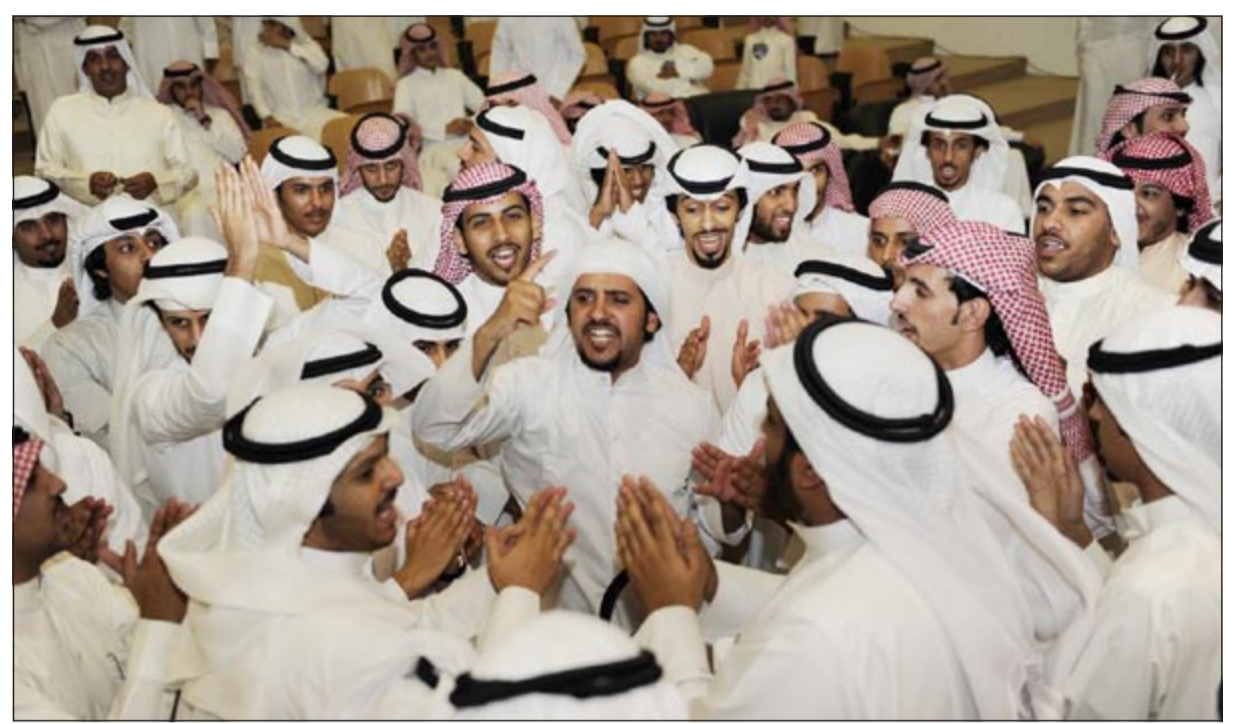
جانب من المشاركين في المهرجان الخطابي

وأضاف المحم: ان «المستقبل الطلابي» تمثلت جميع أطراف المجتمع من قبائل وحضر وبدو وستة وشيعة ولن يتخلل بوقوفهم مع جميع الطلبة في تحقيق طموحاتهم المستقبلية الأكاديمية والعلمية، ودعا المحم منسوق العام لقائمة المستقلة ورئيس الاتحاد الى مناظرة امام الجموع الطلابية لكشف الحقائق وقصورهم تجاه الجموع الطلابية، مؤكدا أنه