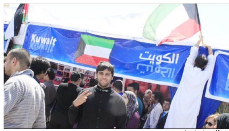
جناح الكويت في المهرجان

عن ارادتهم. وفي لحظة طريفة تؤكد لنا تلاحم طلبة الكويت وابتداء هذا الشعب في موقف أكثر من رائع من الشباب الكويتي تشابكت الأيدي ونددت الأفواه بأروع الأغاني الشعبية وقدموا رقصات شبابية رائعة تعبر عن روح التعاون ليتغلبوا على الوتيرة المخيبة للأمال وتحول تلك الخيبة الى نشوة فرح وسعادة، وفي ختام المجلس الثقافي العالمي الثامن في جمهورية مصر العربية كرمت ادارة المهرجان الكويت لجهودها وحضورها للمهرجان وتسلم المكرمون درعا تذكارية مع النقاط بعض الصور لهذا المنقلى الثقافي الدولي، وبعد المجلس الثقافي العالمي احد رموز الثقافة على المستوى العالمي. وشاركت عشرات الدول في نسختها الثامنة من مختلف القارات عبر معارض منظمة وراقية توضح لزوارها ثقافة ووطنهم وحضارتهم.