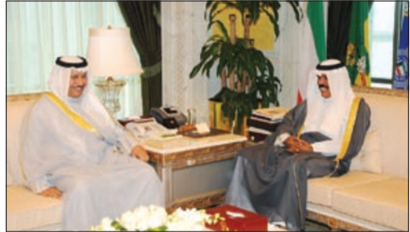
سمو ولي العهد الشيخ نواف الأحمد مستقبلا سمو رئيس الوزراء الشيخ جابر المبارك

استقبل سمو ولي العهد الشيخ نواف الأحمد في ديوانه بقصر السيف صباح أمس رئيس مجلس الأمة علي الراشد. واستقبل سموه الشيخ جابر المبارك رئيس مجلس الوزراء.