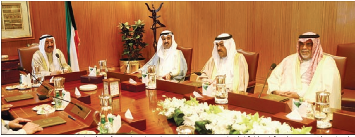
صاحب السمو الأمير مترسدا الجلسة الاستثنائية لمجلس الوزراء بحضور علي الراشد والشيخ أحمد الحمود والشيخ أحمد الخالد

استقبل صاحب السمو الأمير الشيخ صباح الأحمد بقصر السيف صباح أمس سمو ولي العهد الشيخ نواف الأحمد.