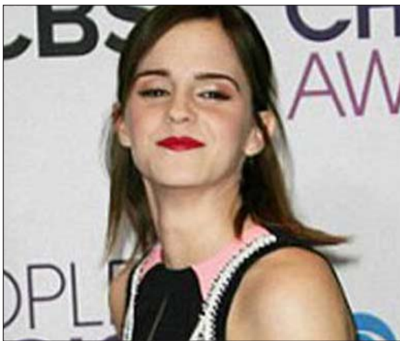
نجمة افلام هاري بوتر واتسون