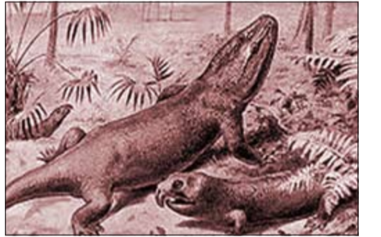
أحفور لسحلية منقرضة

أطلق علماء أحافير روس اسم «لينين» على أحفور لسحلية الأكلور التي انقرضت منذ 65 مليون عام، تيمنا بالزعيم الثوري الروسي الراحل فلاديمير لينين.