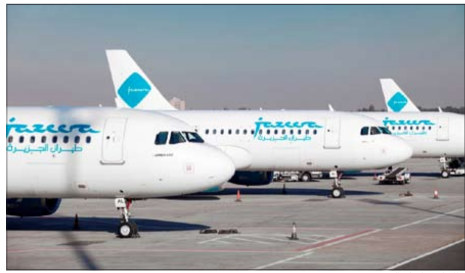
طائرات «طيران الجزيرة»

وبالنسبة للوجهات المصرية التي تخدمها «طيران الجزيرة»، كانت الشركة أكبر ناقلية على خط الكويت - أسبوط بحصة سوقية بلغت 63%، وعلى خط الكويت - البحرين، وبنسبة 72%، وعلى خط الكويت - أسبوط بحصة سوقية بلغت 50%.