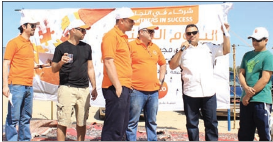
مسابقات ومنافسة وترفيه

على اقامة مثل هذه الانشطة بأهمية العنصر البشري في تحقيق النجاح والانجازات. لموظفيها لايانها العميق