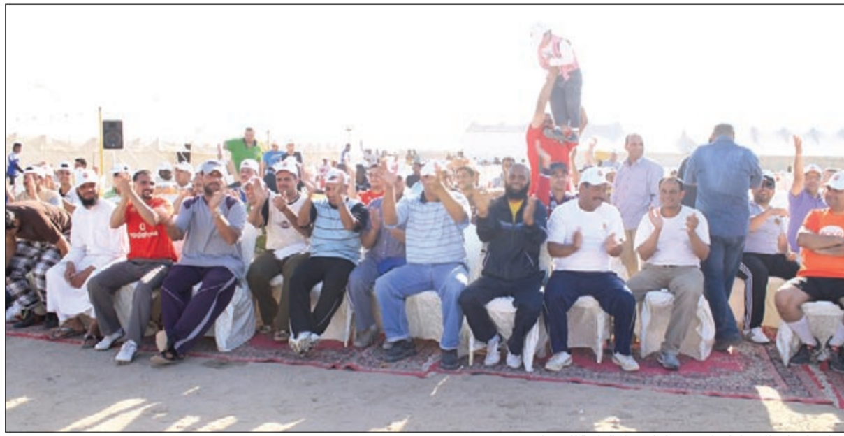
موظفو أسيكو للصناعات استمتعوا بالاجواء الرائعة لليوم المفتوح