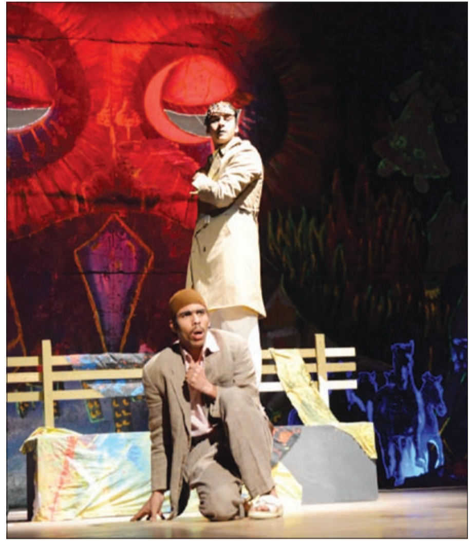
مشهد من مسرحية «مسافر ليل»