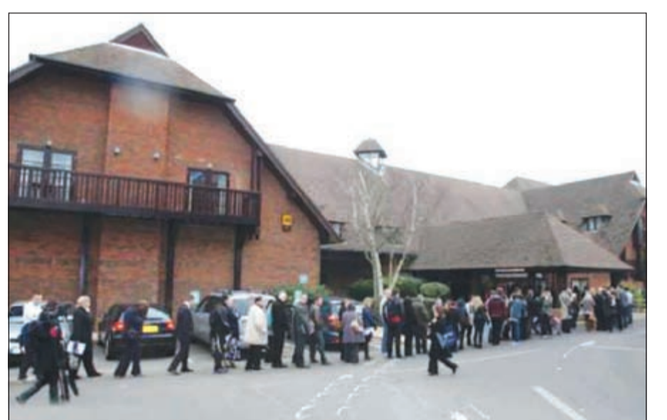
الآلاف في طابور انتظار وظيفة

لندن - وكالات: اصطف أربعة آلاف شاب بريطاني في طابور، يزيد طوله على الكيلومتر، لمدة ساعات، يحثا عن فرصة عمل في مول تجاري بمقاطعة «هامبشير»، وهو ما يرسم صورة «بريطانيا البائسة»، حسب صحيفة «الديلي ميل» البريطانية. وقالت الصحيفة: إنه جيل من العاطلين، لم يتردد خلاله الآلاف في الانضمام لطابور اصطف أمام فندق «سولتن» بمدينة «وايتلي»