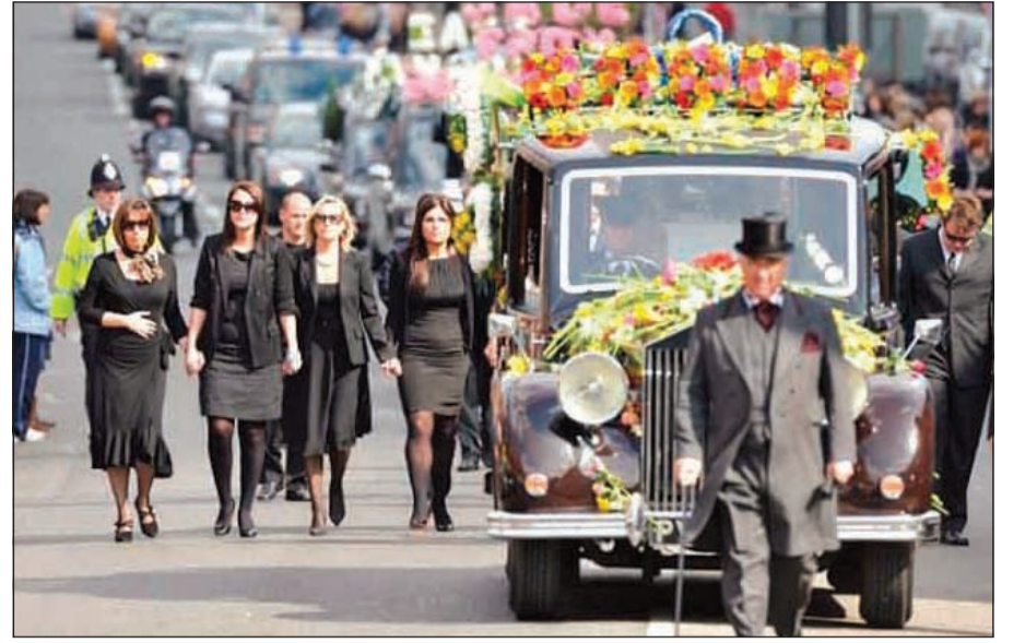
أحدى الجنائز في لندن

واشنطن - أ.ف.ب: تعزز نجمة التلفزيون الأميركية باربرا والترز البالغة 83 عاما الاعتزال، وفق ما أفادت الصحافة الأميركية. وأوضحت صحيفة نيويورك تايمز نقلا عن مصدر مطلع أن خبر الاعتزال سيتم الإعلان عنه خلال برنامج والترز الحوار اليومي «ذي فيو» على قناة «إيه بي سي»، وسيتم خلال الحلقة عرض تقرير تحريفي يروي محطات مسيرة والترز في «إيه بي سي» منذ انطلاقها في العام 1976. وكانت والترز قبل ذلك تعمل في قناة «إن بي سي» حيث شاركت في تقديم برنامج «توداي» الصباحي. من جانبها أكدت صحيفة «هوليوود ريبورتر» المتخصصة في أخبار النجوم أن والترز التي أصيبت بمرض السعال الديكي مطلع العام الحالي وفق وسائل الإعلام الأميركية، ستبدأ مرحلة التقاعد في مايو 2014. ولم تعلق «إيه بي سي نيوز» ولا باربرا والترز على هذه المعلومات حتى مساء الخميس. وكانت والترز التي قابلت خلال مسيرتها مئات الشخصيات والمشاهير، أول امرأة تقدم نشرة أخبارية مسائية في الولايات المتحدة في العام 1976.