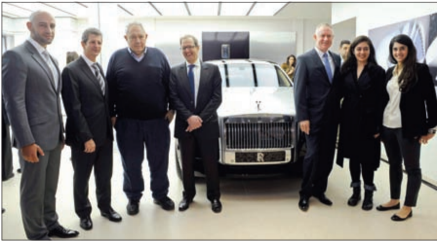
لقطة جماعية لقيادات رولز رويس

ومع هذا الافتتاح الجديد، يصل عدد صالات عرض «رولز - رويس» إلى 10، ويؤكد هذا التوسع على صدارة «رولز - رويس» في قطاع السيارات الفاخرة في السوق.