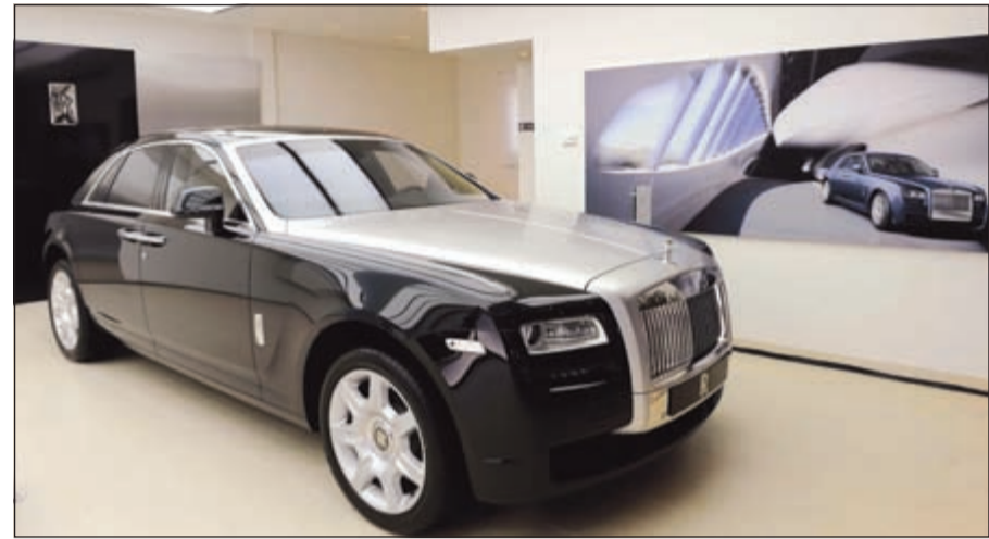
رولز رويس الجديدة

وستقبلها الباهر» وقال ألبرت بسول، رئيس مجلس الإدارة في شركة «بسول وحنينة»: «يسعدنا أن تكون الوكيل الحصري لعلامة «رولز - رويس» في لبنان، تعد صالة العرض الجديدة هي الاستثنائية