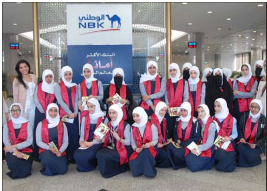
طالبات ثانوية صباح السالم في صورة جماعية خلال زيارتهن إلى البنك الوطني

أكثر على اهتمامهم، وتوظيف هذه الاهتمامات بدورهن، تفاعلت الطالبات مع ما قدمه فريق العلاقات العامة من شرح حول العمل المصرفي والتعريف بالخدمات المتنوعة التي يوفرها البنك، وتناول في قسم صناديق الأمانات حيث تعرفن على أهمية توافر مثل هذه الصناديق لتأمين الحماية والأمان للمقتنيات الثمينة. ويحرص البنك الوطني على التواصل مع المؤسسات التعليمية والإهتمام بشريحة الشباب، ليس فقط من خلال الخدمات التي يوفرها البنك لهذه الفئة من العملاء، ولكن أيضا من خلال توفير العديد من الفرص التدريبية مثل التدريب الميداني وبرامج التدريب الصيفي.