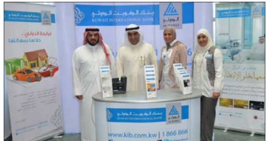
جناح البنك الدولي في ديوان المحاسبة

مع موظفي ومراجعى الديوان، والإجابة على استفساراتهم وتساؤلاتهم حول العروض والخدمات والمنتجات المصرفية التي يقدمها «الدولي» وفق أحكام الشريعة الإسلامية. وختمت السويدي «أن جناح بنك الكويت الدولي مقر ديوان المحاسبة حقق الأهداف المرجوة، الأمر الذي انعكس على الإقبال الكبير على جناح البنك». مضيفة أن بنك الكويت الدولي مستمر في تطوير منتجاته وخدماته المصرفية الإسلامية، في ظل سياسته الرامية إلى أن يكون الخيار المفضل للمواطنين في المعاملات المصرفية المتوافقة مع أحكام الشريعة الإسلامية.