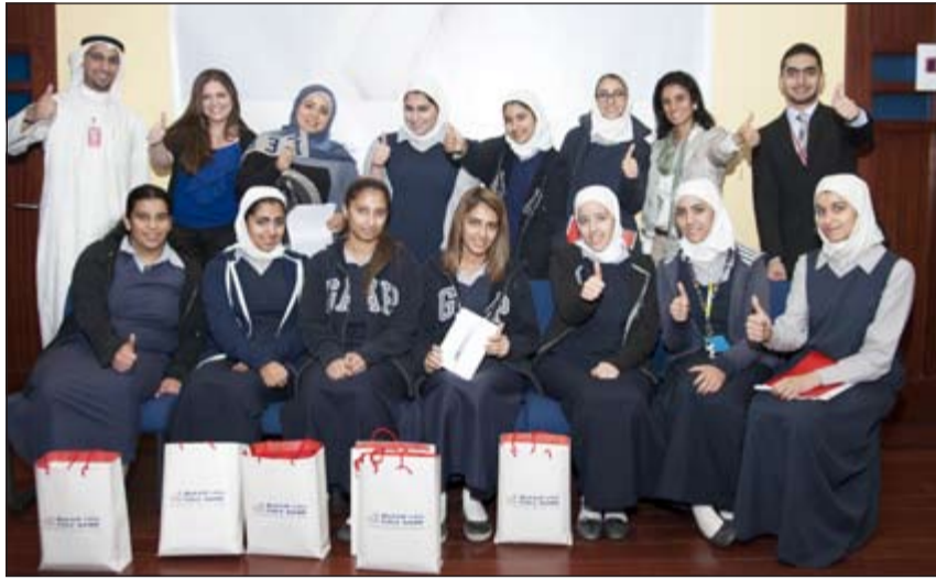
طالبات المدرسة مع إدارة العلاقات الداخلية في البنك