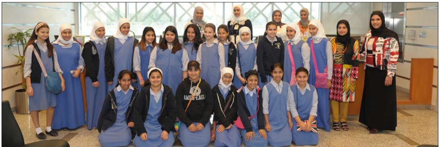
جانب من زيارة الطالبات لفرع «بيتك»

المصرفي وتنمية المهارات والاكتراست مستقبلا في عمل البنوك والمؤسسات المالية لاسيما الإسلامية. وأبدت طالبات مدرسة النزهة اهتماما بهذه الجولة التعريفية خاصة النقاش الذي تم طرحه والتساؤلات التي تمت الإجابة عليها، كما اثنين على جهود «بيتك» ومستوى خدماته ومساهماته المتعددة في المجال الاقتصادي والاجتماعي علاوة على ريادته في الصيرفة