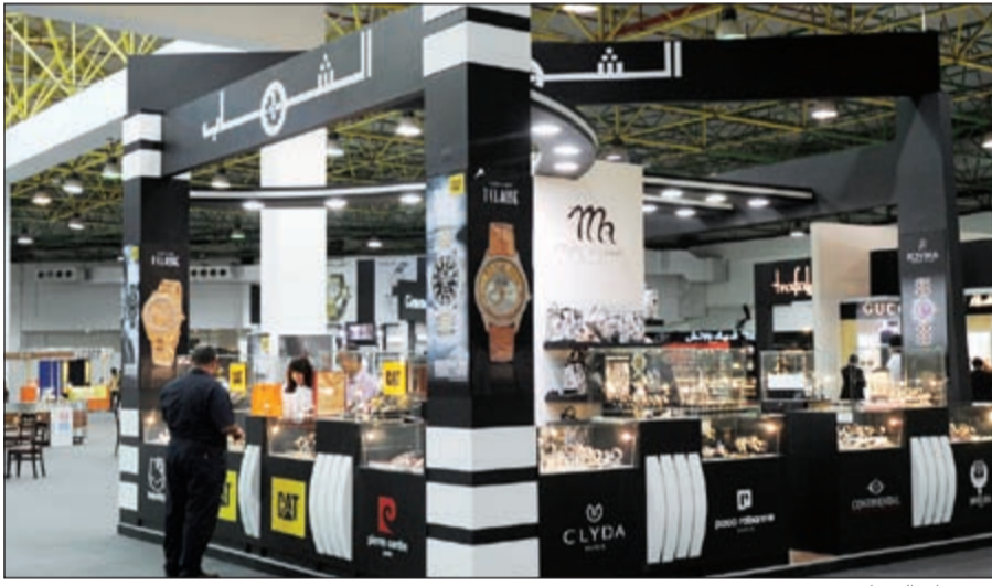
.. وجناح الشباب

هذا ويتميز جناح شركة روائع جنيثف للساعات للسنة السادسة عشرة على التوالي بمعرض مشرف بالدبوكور الداخلي الذي جاء مواكبا للتغيرات التي أجرتها الشركة أخيرا على أسلوب العرض، إذ أصبح لكل ماركة قسم خاص فيه من روح الماركة ما يدل عنها، وما يساعد العملاء في العثور على ما يرغبون في اقتنائه من ماركات لساعات عالمية، ومنها: موريس، جون جليانو، نينا ريتشي، لميرغيني، شيروتي، فالنتينو، أجنر، فندي، بيير كاردين، روشاس، سانت أوثره، روبرتو كافلي، فيراري، لويجو، جاي لاروش، كستيان لاجروا، فوج، هاتف لامبورجيني وجميعها توفر فرصة استثنائية للعملاء في الحصول على ما يرغبون في اقتنائه، وما يؤكد ريادة اسم «جنيثف غاليري» كأحد أكبر الشركات المالكة لأكثر الساعات شهرة في العالم.