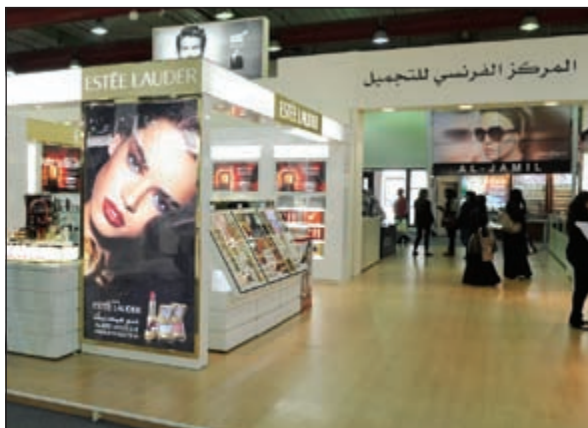
جناح المركز الفرنسي

«أرض المعارض»: نهاية المعرض في 30 الجاري وسط إقبال جماهيري غير مسبوق