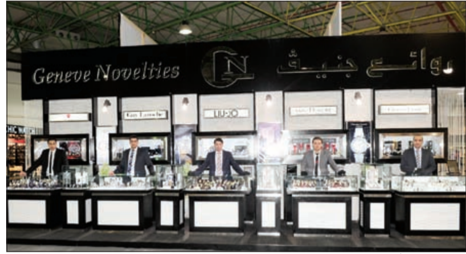
جناح روائع جنيثف

هذا ويتميز جناح شركة روائع جنيثف للساعات للسنة السادسة عشرة على التوالي بمعرض مشرف بالدبوكور الداخلي الذي جاء مواكبا للتغيرات التي أجرتها الشركة أخيرا على أسلوب العرض، إذ أصبح لكل ماركة قسم خاص فيه من روح الماركة ما يدل عنها، وما يساعد العملاء في العثور على ما يرغبون في اقتنائه من ماركات لساعات عالمية، ومنها: موريس، جون جليانو، نينا ريتشي، لميرغيني، شيروتي، فالنتينو، أجنر، فندي، بيير كاردين، روشاس، سانت أوثره، روبرتو كافلي، فيراري، لويجو، جاي لاروش، كستيان لاجروا، فوج، هاتف لامبورجيني وجميعها توفر فرصة استثنائية للعملاء في الحصول على ما يرغبون في اقتنائه، وما يؤكد ريادة اسم «جنيثف غاليري» كأحد أكبر الشركات المالكة لأكثر الساعات شهرة في العالم.