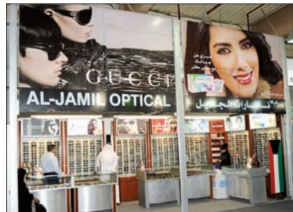
جناح نظارات التجميل