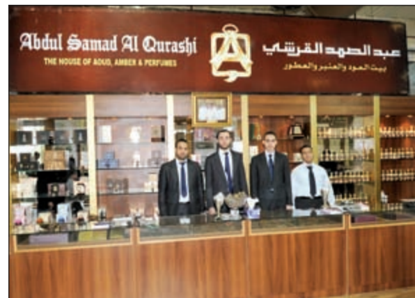
جناح عبدالصمد القرشي