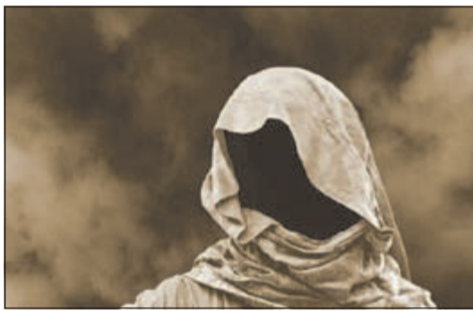
الخيال العلمي يمكن أن يصبح حقيقة