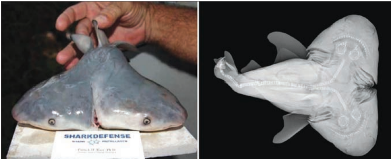
صورة سمكة القرش ذات الرأسين وبجانباها صورة أشعة الرنين المغناطيسي لجسمها

مايكل واغرن أن هذه حالة نادرة في عالم الطبيعة مضيفا أن كائنات كهذه من الأرجح أن تموت بعد مرور فترة وجيزة من الولادة، وهو بالضبط ما حصل في السمكة المكتشفة. كما أشار إلى وجود الكثير من هذه النماذج بين العظاءات والأفاعي والسلاحف.