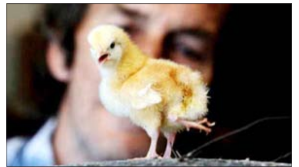
صورة إرشيفية لصوص ذي القوائم الأربعة في أستراليا