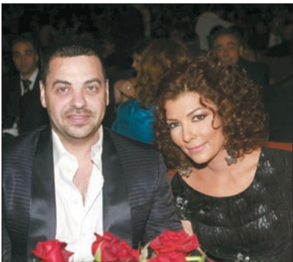
أصالة وزوجها طارق العريان

احتفلت الفنانة أصالة وزوجها المخرج والمنتج طارق العريان بعيد زواجهما السابع، وكعادتها تغزلت أصالة في العريان على حسابها الرسمي بموقع «تويتر».