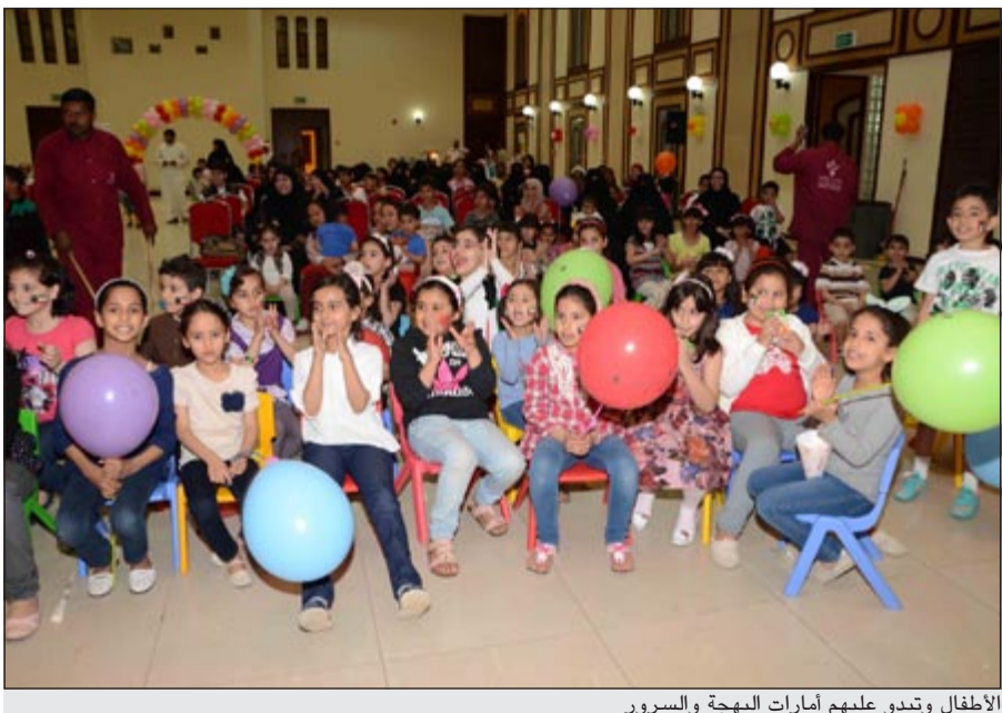
الأطفال وتبدو عليهم أمارات البهجة والسرور