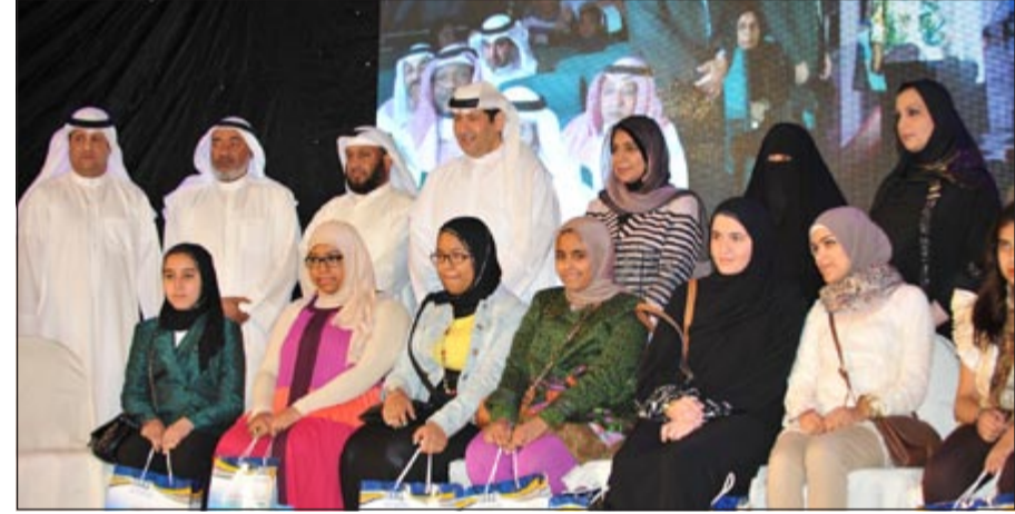
جانب من حفل تكريم المتفوقات