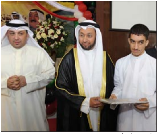
متفوق يتسلم تكريمه