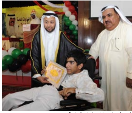
تكريم أحد ذوي الاحتياجات الخاصة