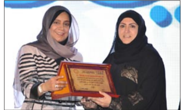
تكريم إحدى عضوات الهيئة التعليمية