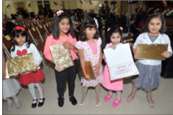
كوكبة من المتفوقات