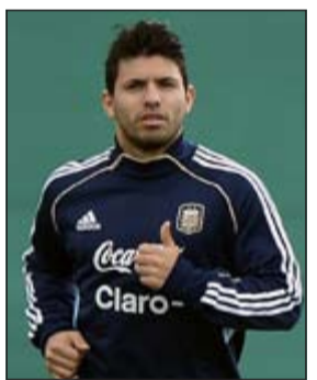
أغويرو في تدريبات الأرجنتين

مع اللاعبين الكولومبي هدف ثاني فرق العاصمة. من جانبها، ربطت صحيفة (سبورت) أغويرو ببرشلونة في حالة رحيل ديفيد فيا عن الفريق الكاتالوني. وقالت «صبر أغويرو يعتمد على فيا. العمر يصب في مصلحته (24 عاما مقابل 31 لاسباني) وعلاقته الشخصية والكروية الجيدة مع ميسي. في المقابل، يصب ضده سعره المرتفع والنقاش الدائم حول كون فيا مهاجما صريحا، لكن: هل يحتاج برشلونة حقا لمهاجم صريح؟»، ولا يمر الأرجنتيني بأفضل أوقاته حاليا مع ماني ستي، فإذا كان موسمها الأول قد شهد تسجيله 30 هدفا، فضلا عن صناعة 12 أخرى، فإنه لم يسجل هذا