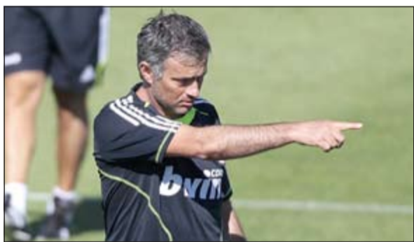
مدرب ريال مدريد جوزيه مورينيو

الى ريال مدريد، حيث وضع حدا للسيطرة برشلونة على اللقب على مدى ثلاثة مواسم وقاد الفريق الملكي الى اللقب المحلي الموسم الماضي. وهو مرشح لإحراز كأس اسبانيا هذا الموسم للمرة الثانية على التوالي ومن أبرز المرشحين لإحراز لقب دوري ابطال أوروبا. ونقلت صحيفة «ديلي ميل» عن مصادر مطلعة في أروقة النادي للندن أن مورينيو سيعود الى تدريب تشلسي الموسم المقبل، وان النادي لا يستطيع اعلان ذلك رسميا احتراما للعدد الذي يربط مورينيو بريال مدريد.