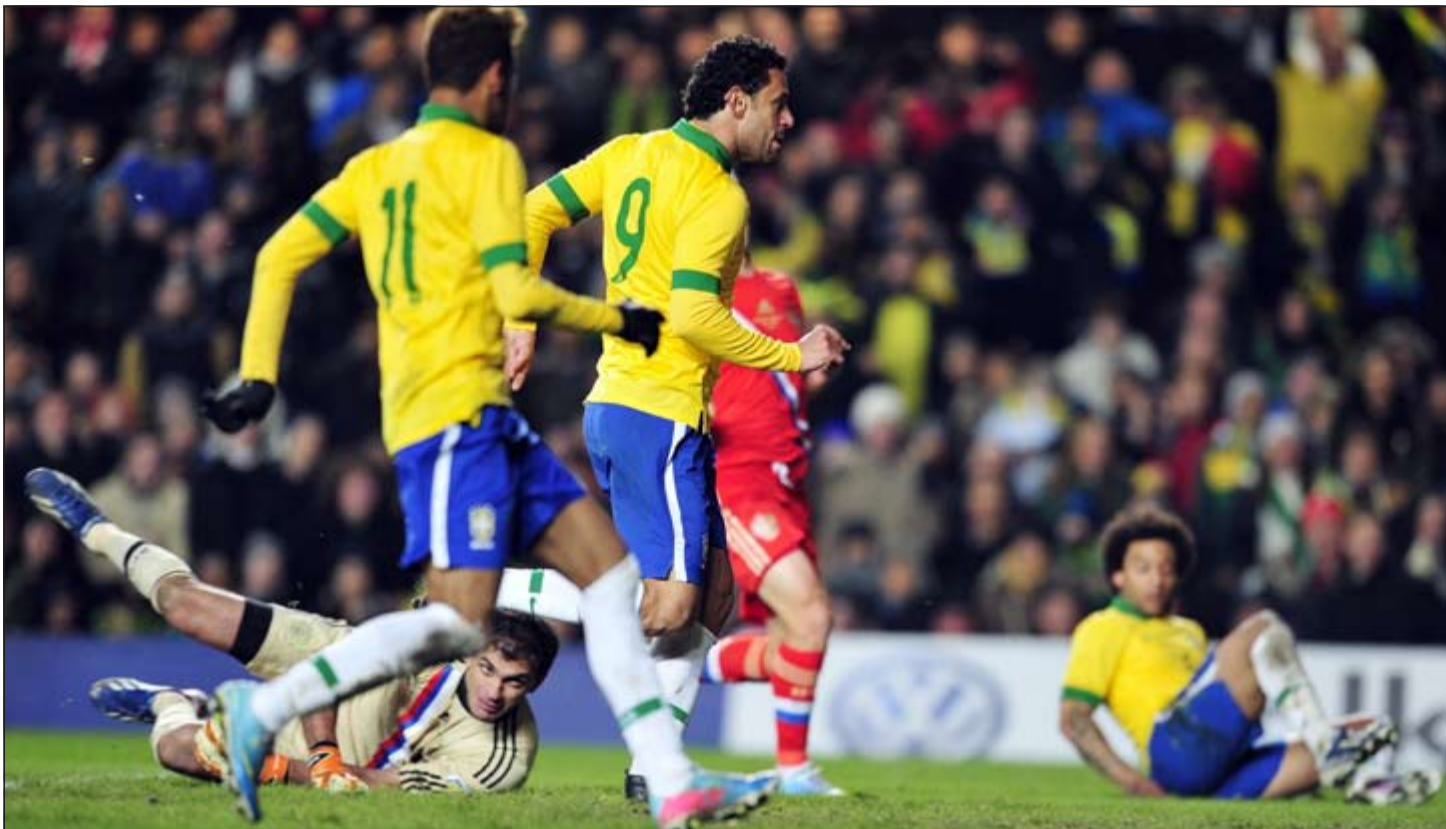
مهاجم البرازيل فريد سجل هدف التعادل للبرازيل في الوقت القاتل

لم يكن تصريح جوزيه مورينيو قبيل أيام بريثا عندما قال أنه لا شيء يمنعه من تدريب فريق سبق له الإشراف عليه سابقا، إذ يبدو ان مالك تشلسي الإنجليزي الروسي رومان ابراموفيتش فتح الباب امامه للعودة الى صفوف الفريق اللندني الذي تركه عام 2007 بعد أن قاده الى إحراز خمسة القاب في مدى ثلاث سنوات ونصف السنة. وتترك مورينيو منصبه بعد خلافات حادة مع ابراموفيتش في قرار لم يعجب انصار النادي الذين خرجوا بتظاهرات طالبت بإعادة المدرب الى منصبه من دون طائل. لكن المقربين من رجل الأعمال الروسي يؤكدون ان العلاقة تحسنت في الآونة الأخيرة وقد أهدي المليادير الروسي، مورينيو ساعة ذهبية تقدر بـ 250 ألف دولار. وحقق مورينيو نجاحات كبيرة بعد رحيله عن تشلسي، إذ تسلم مورينيو نجاحات كبيرة بعد تدريب انترميلان وقاده الى ثلاثية تاريخية (الدوري والسكاس المحليان ودوري ابطال أوروبا) قبل أن ينتقل