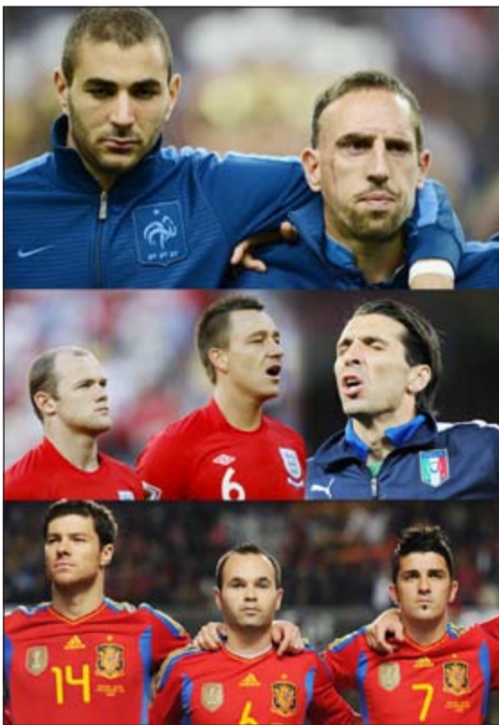
بنزيمية لا يحفظ النشيد الوطني لفرنسا. وروني صامت وتيري يردد النشيد. ولاعبو اسبانيا سعداء بنشيدهم الصامت