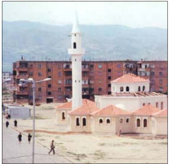
مركز السيدة غنيمة المرزوق أحد مشاريعها الخيرية في إسبانيا