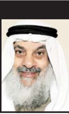
الشيخ أحمد الفلاح

«أنا شخصيا اعتبرها نموذجا للمجلات التي تهتم بقضايا الأسرة».