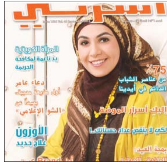
لمكي لا يقصص عدد حسابكنا