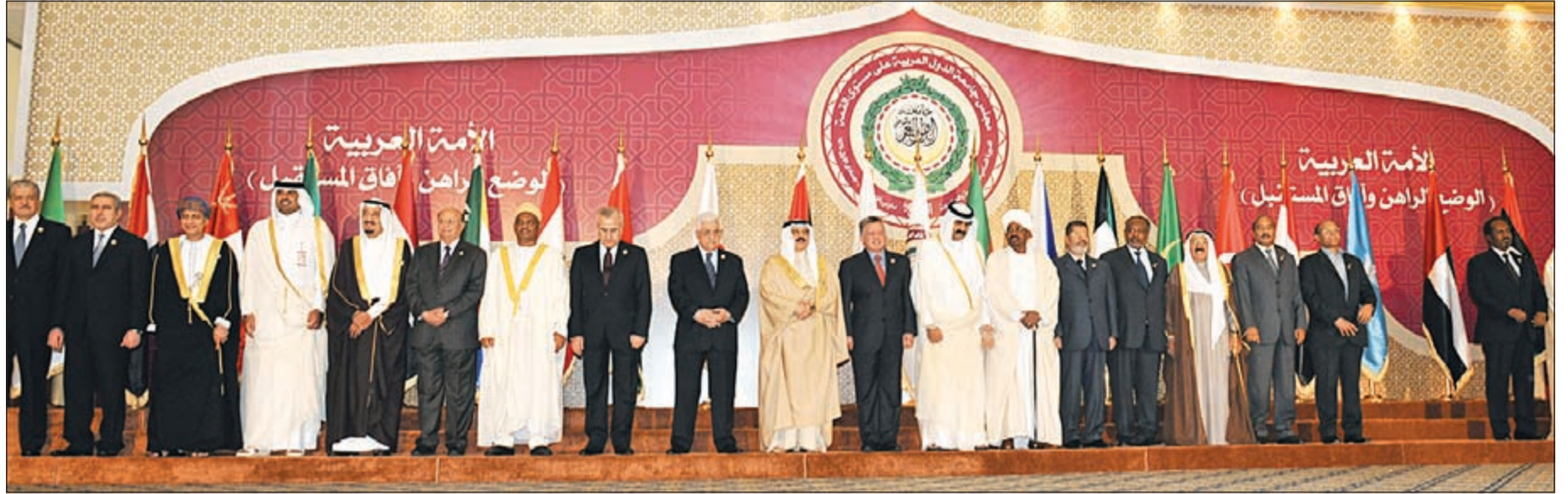
قادة الدول العربية وممثلوهم في صورة تذكارية في قمة الدوحة

فصائله للتوصل الى السلام الشامل والعدال. وأوضح ان قرار الأمم المتحدة القاضي بمنح فلسطين صفة المراقب غير العضو في الهيئة الدولية يعكس ارادة الغالبية الساحقة في المجتمع الدولي ويجب استنثاره لتحقيق واستكمال مقومات الدولة الفلسطينية المستقلة على حدود 1967 وعاصمتها القدس الشريف، وصولاً الى دولة كاملة العضوية في الأمم المتحدة.