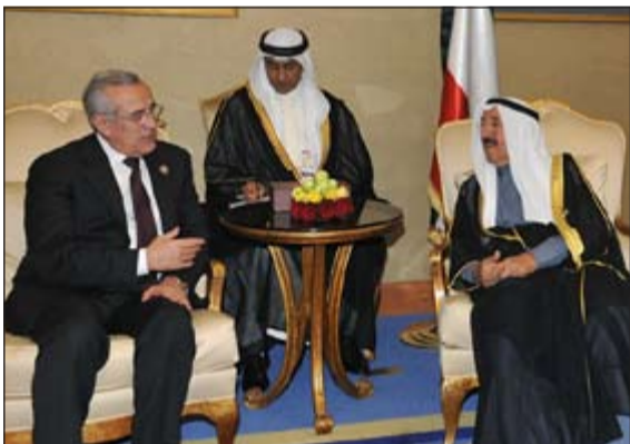
صاحب السمو الأمير مستقبلا الرئيس اللبناني