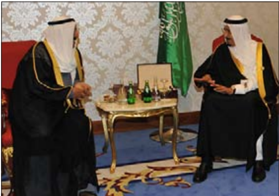
جانب من لقاء سمو الأمير وصاحب السمو الملكي الأمير سلمان بن عبدالعزيز