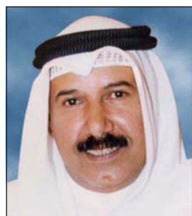
السفير علي الهيبي

الدوحة - كونا: أكد سفيرنا لدى دولة قطر علي الهيبي سعي الكويت الدائم الى فتح آفاق جديدة للتعاون العربي الذي ينصب بمجمله في الوصول الى آمال وطموحات الشعوب العربية في شتى المجالات.