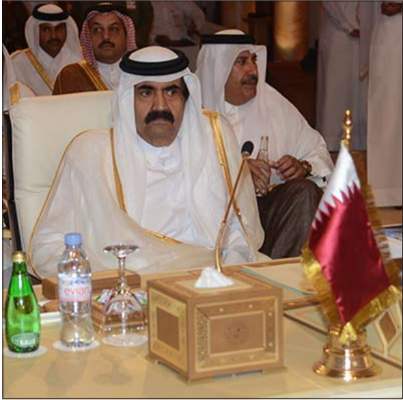
الشيخ حمد بن خليفة مترشداً وفد قطر