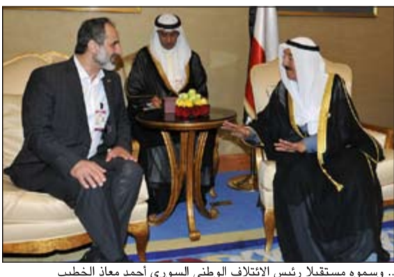
.. وسموه مستقبلا رئيس الائتلاف الوطني السوري أحمد معاذ الخطيب

الدوحة - كونا: قام صاحب السمو الأمير الشيخ صباح الأحمد مساء اليوم بزيارة إلى أخيه صاحب السمو الملكي الأمير سلمان بن عبدالعزيز آل سعود ولي العهد نائب رئيس مجلس الوزراء وزير الدفاع بالملكة العربية السعودية الشقيقة وذلك بمقر إقامة سموه في العاصمة الدوحة. واستقبل سموه مساء أمس رئيس الائتلاف الوطني لقوى الثورة والمعارضة السورية أحمد معاذ الخطيب والوفد المرافق وذلك بمقر إقامة سموه في العاصمة الدوحة. كما استقبل سموه مساء أمس وزراء خارجية جمهورية تركيا الصديقة أحمد داود أوغلو وذلك بمقر إقامة سموه في العاصمة الدوحة. كما استقبل سموه مساء أمس وزير خارجية جمهورية العراق الشقيقة د.خضير الخزاعي والوفد الرسمي المرافق وذلك بمقر إقامة سموه في العاصمة الدوحة. واستقبل سموه مساء أمس رئيس وزراء ليبيا ليبيا الشقيقة علي زيدان ومحمد والوفد المرافق وذلك بمقر إقامة سموه في العاصمة الدوحة. حضر اللقاءات أعضاء الوفد الرسمي المرافق لسموه.