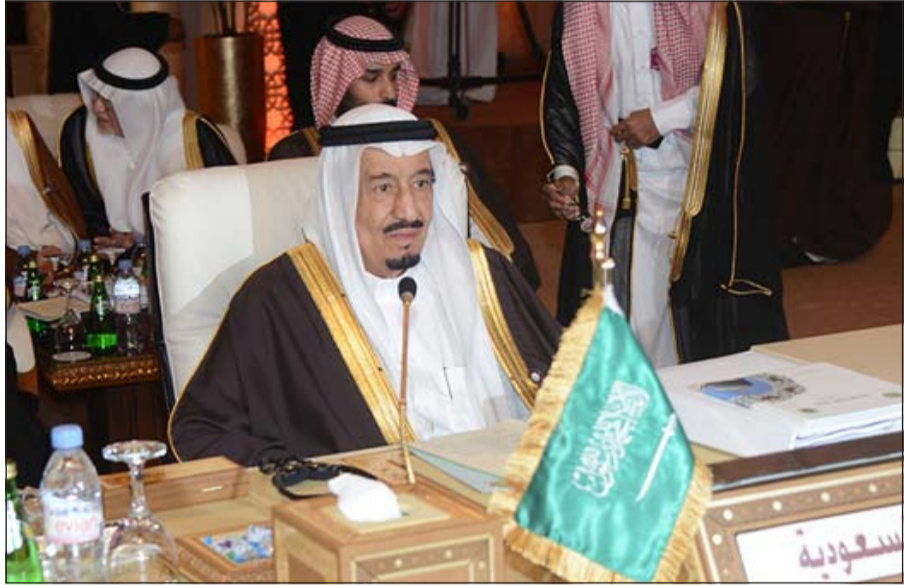
صاحب السمو الملكي الأمير سلمان بن عبدالعزيز خلال القمة