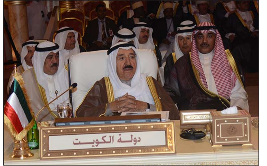
صاحب السمو الأمير الشيخ صباح الأحمد مترشحا وفد الكويت في القمة