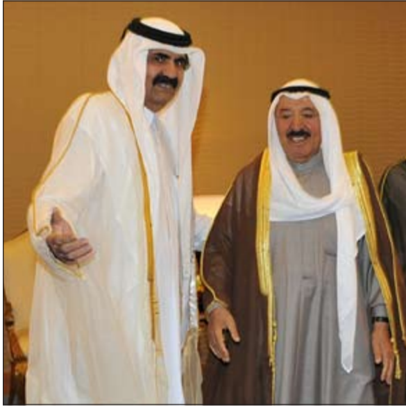
الشيخ حمد بن خليفة مرحبا بصاحب السمو الأمير الشيخ صباح الأحمد