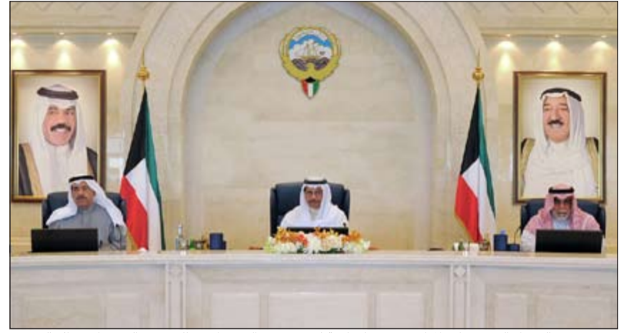
سمو رئيس الوزراء الشيخ جابر المبارك مترئسا جلسة امس ويبدو الشيخ احمد الحمود والشيخ احمد الخالد

المجلس اطلع على شرح حول التحديات المختلفة التي تواجه النظام التعليمي في ابعادها الاقتصادية والاجتماعية والتنظيمية