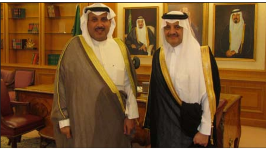
الأمير سعود بن نايف مستقبلا الشيخ حمد جابر العلي

الدمام - كونا: استقبل أمير المنطقة الشرقية بالملكة العربية السعودية الأمير سعود بن نايف بن عبدالعزيز وزير الإعلام الأسبق الشيخ حمد جابر العلي والوفد المرافق له. وقال العلي عقب اللقاء انه قدم التهنية للأمير سعود بن نايف على تعيينه أميراً على المنطقة الشرقية ونيله ثقة خادم الحرمين الشريفين الملك عبدالله بن عبدالعزيز. وأشاد بتعاون الأمير سعود المستمر مع اخوانه الكويتيين طيلة سنوات عمله خاصة خلال ترؤسه منصب رئيس ديوان ولي العهد في المملكة والخدمات والتسهيلات التي قدمها لحجاج الكويت وحملات الحج الكويتية. وأضاف العلي ان الأمير سعود