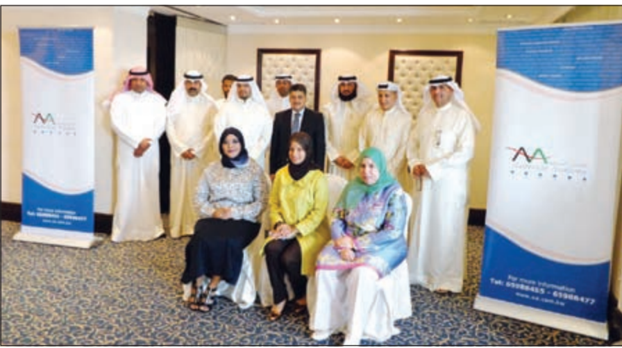
المشاركين في البرنامج

ضمن إطار التعاون المشترك بين معهد الأكاديمية الأسترالية للدراسات والتدريب الأهلي ووزارة المالية، فقد اختتمت الأكاديمية الأسترالية البرنامج التدريبي «جرائم التزوير والغش والاحتيال المالي» والذي عقد خلال الفترة من 10-14 مارس 2013 لصالح موظفي وموظفات وزارة المالية. ويعتبر البرنامج من البرامج المهمة التي تهدف إلى تنمية مهارات المشاركين العاملين في القطاع المالي على طرق اكتشاف جرائم الاحتيال المالي والأساليب المستخدمة للقضاء عليها. وقد أشاد المحاضر بمستوى تفاعل المشاركين واهتمامهم بطرح خبراتهم مما أثرى