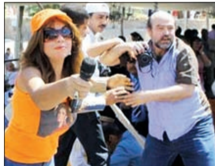
بوسي شلبي وصورة يسرا على التي شيرت

أطلقت المذيعة بوسي شلبي «تقليعة» جديدة بين الفنانين، إذ فوجئ الجميع بارتدائها «تي شيرت» يحمل صورة الفنانة يسرا. هذا الأمر أثار دهشة الفنانين المشاركين في أنشطة مهرجان الأقصر السينمائي.