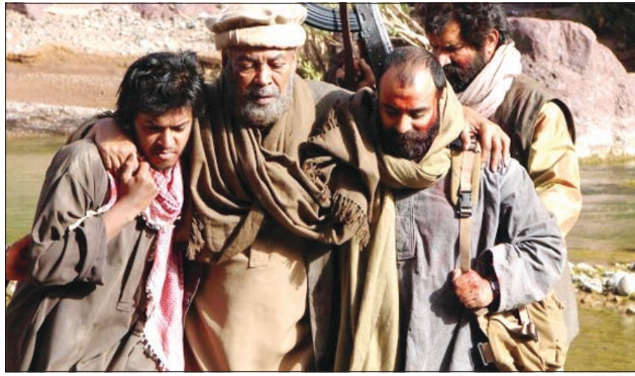
الفنان الكبير سعد الفرج في «تورا بورا»

وعما إذا أنشأت الحكومة هيئة عامة للسينما تابعة لها، وهل سيؤثر ذلك على دور النادي وهو جمعية نفع عام؟ قال: نحن نطالب بأي باب يفتح لصناعة السينما وإيجاد هيئة حكومية كويتية مسؤولة عن السينما وصناعتها، اعتقد أنه حلم ومستبعد، «با جماعة الخير» هناك دول في الخليج سبقتنا الآن ولديها مهرجانات دولية تستقطب أشهر النجوم، ما المشكلة أن يستقطع جزء من ميزانية الدولة للسينما مثل المسرح والتلفزيون؟ لأننا هنا