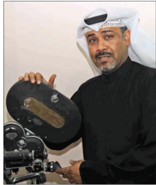
.. وأمام كاميرا في مقر النادي

الالف إلى الباء. وأردف رئيس مجلس إدارة نادي الكويت للسينما، قائلاً: جميعنا يعلم أن محاولات شبابنا لا يمكن أن تفرى الساحة السينمائية الكويتية وإنما غير ملحوظة مقابل صغر حجم الصناعة عندنا.