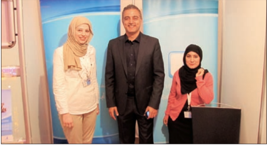
جانب من جناح مستشفى السيف المشارك في معرض صحة الكويت الرابع

التسويق والعلاقات العامة في مستشفى السيف عن سعادتها للمشاركة في هذا المعرض والذي ان دل فإنها يدل على حرص مستشفى السيف على تقديم كل الإمكانيات المطلوبة لخلق بيئة صحية مناسبة ونشر التوعية الملائمة لخدمة ومصحة أفراد المجتمع.