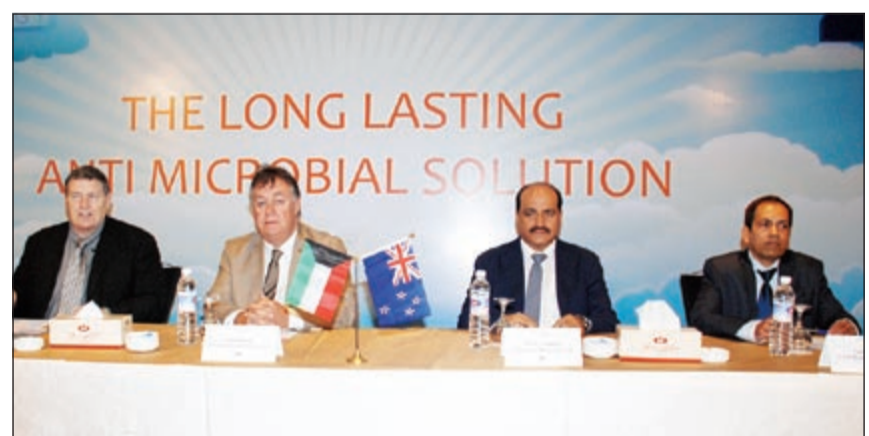
جانب من المؤتمر الصحافي لإطلاق Zoono

منتجات Zoono غير مؤذية للبشر والحيوانات الأليفة، وتستخدم في المستشفيات والعيادات والمدارس وروضات الأطفال، فنادق، مطاعم، مطبخ، مراكز التسوق، مسارح، مطارات، الحمامات العامة، مطابخ المركزية، البنوك، المساجد، وما إلى ذلك. مجموعة Zoono هي شركة مقرها نيوزيلندا التي بدأت إعادة تطوير تكنولوجيا فريدة من نوعها. Zoono الآن موجودة في 42 بلدا تقريبا بما في ذلك الإمارات العربية المتحدة وتركيا، والمملكة العربية السعودية. منتجات Zoono لديها فاعلية 24 ساعة على جلد الإنسان، والمناطق 30 يوما على أي سطح.