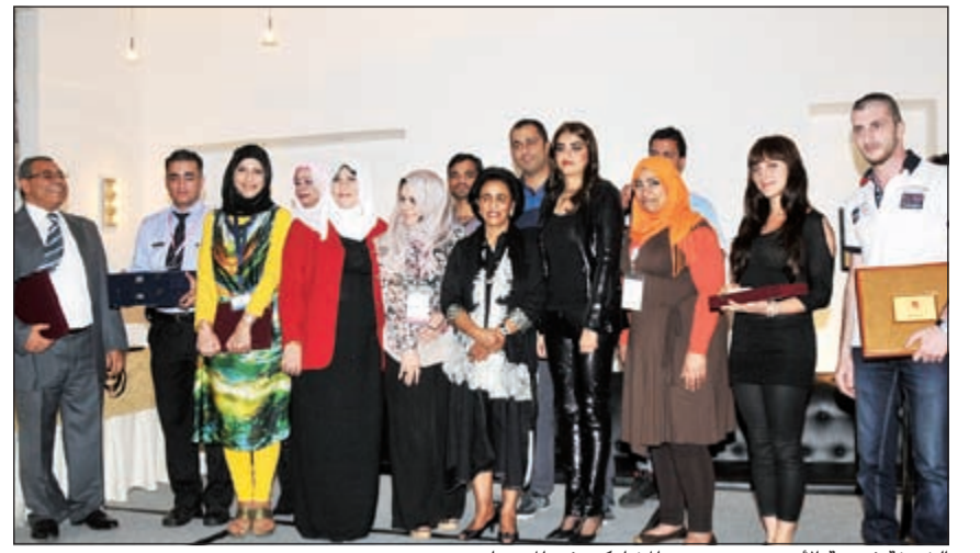
الشيخة فريحة الأحمد مع عدد من المشاركين في المهرجان