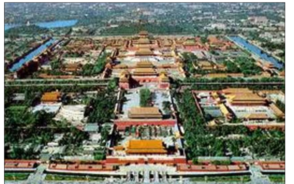
المدينة الحمراء في الصين

لندن - إيلاف: تنظم شركة Hurlingham للسفر رحلة تمتد لسنتين سيتم خلالها زيارة العديد من المعالم الفاخرة والتعرف إلى مواقع الأونسكو التراثية حول العالم، وتبلغ تكاليف الرحلة نحو 1,5 مليون دولار. وفي التفاصيل، تشتمل هذه الرحلة على زيارة جميع معالم الأونسكو التراثية حول العالم وهي بحدود 962 معلما، ومنها تاج محل في الهند، الأهرامات في مصر، والمدينة المحرمة في الصين، إضافة إلى أماكن غير معروفة عالميا مثل البيوت الخشبية في السويد،