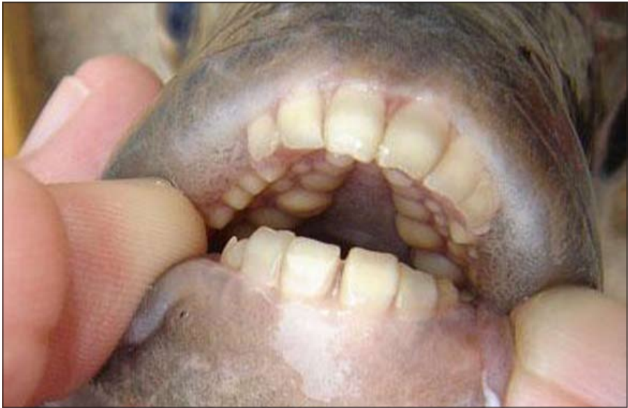
سمكة بأسنان إنسان

قوية جدا، تمتاز بعضلات صلبة، ومعروفة بمهاجمتها لأنواع الأخرى من الأسماك، وللشعر أيضا. وكما جاء في موقع داييلي مايل، فهذه السمكة تهاجم الخصيتين عند الرجال، وهي السبب في وفاة صيادين اثنين في الأونة الأخيرة، حيث فارقا الحياة بعد نزيف دموي مبالغ فيه أثر تعرضهما للعض.