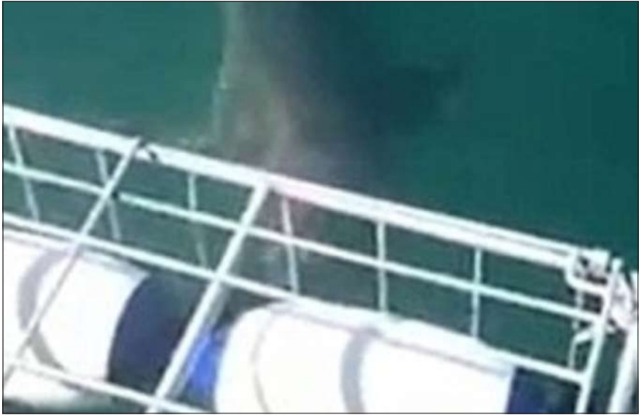
القرش يهاجم الزوجين