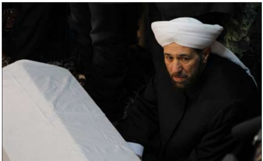
مفتي سورية أحمد حسون بجوار جثمان العلامة محمد سعيد رمضان البوطي قبل دفنه (إ.ف.ب.)

وتحدث في خطبة القاها في 8 الجاري عن «غزو شامل متنوع» على سورية «يستعد منا جميعاً أن نخضع لأمر الله سبحانه وتعالى الذي يدعو في مثل هذه الحالة إلى الاستنفار»، أو «إلى ما يسميه علماء الشريعة الإسلامية بالتفجير العام». وأشار البوطي انتقادات المعارضة، حيث أنه ذهب إلى حد تشبيه جيش النظام السوري بالصاحبة إذا أقاموا حدود الله. ولقى الشيخ البوطي حتفه، إثر تفجير انتحاري استهدف مسجد الإيمان بالعاصمة دمشق، الخميس الماضي، كما سقط أيضاً عشرات الأشخاص الذين تصادف تواجدهم بالمسجد.