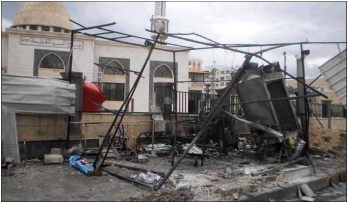
صورة بثها ناشطون للدمار الذي خلفته إحدى قذائف النظام السوري في جامع فاطمة بحي الوعر في حمص

في المقابل رد جيش النظام بقصف عنيف براجمات الصواريخ والمدفعية الثقيلة على حي طريق السد وأحياء درعا البلد. ووقعت اشتباكات