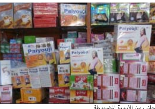
جانب من الأدوية المضبوطة