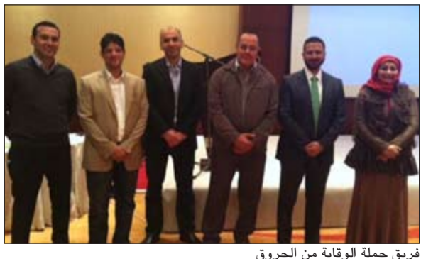
فريق حملة الوقاية من الحروق

ونكر بورزق في تصريح صحافي على هامش اليوم التوعوي للوقاية من الحروق الذي نظمه مركز الباطين للحروق والتجميل بالتعاون مع الإدارة المركزية للرعاية الصحية الأولية، أن نسبة الوفيات جراء الحروق بدأت تقل بسبب توافر الكفاءات المختصة في العيادات الحديثة، معتبراً المركز من أكبر المراكز للحروق في الخليج العربي، حيث يسع 70 سريراً مقسمة على جناحين، وعنابة مركز بها 10 أسرة، مؤكداً على وجود خطة لتوسيعه قريباً لاستيعاب الزيادة السكانية في البلاد.