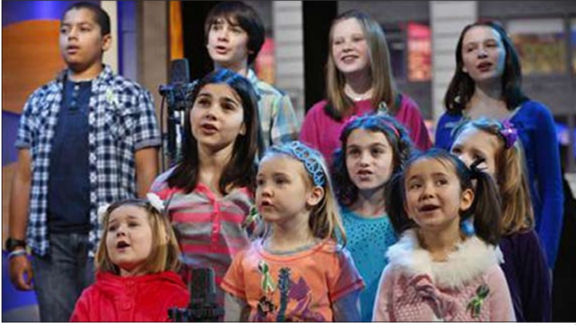
أطفال مصابون بمرض التوحد

اصدرتها المراكز الأميركية لمكافحة الأمراض والوقاية منها قبيل عام والتي قالت إن واحدا من بين كل 88 طفلا في الولايات المتحدة مصاب بالتوحد.