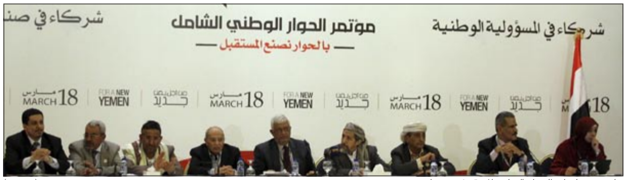
جانب من جلسات الحوار الوطني المنعقد في صنعاء