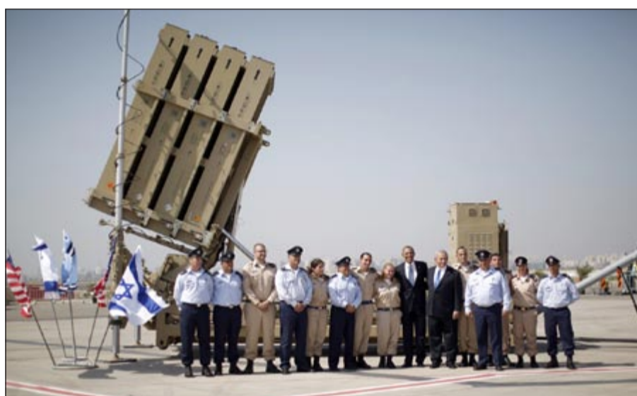
الرئيس الأميركي باراك أوباما وبنيامين نتنياهو أمام إحدى بطاريات «القبة الحديدية» في مطار بن غوريون

الوزراء الإسرائيلي بنيامين نتنياهو وتضيق الاختلافات حول قرب الخطر النووي الإيراني. من جانبه قال الرئيس الإسرائيلي شيمون بيريز أن الصداقة بين إسرائيل وأميركا ستبقى مستمرة، وإن دعم واشنطن لنا لا يمكن أن يتزعزع، وأعرب بيريز عن أمه في وضع حد للزعماء مع الفلسطينيين وأن يتمتع الفلسطينيون بالحريّة في بلادهم، معلناً أن إسرائيل تمدّ يدها بالسلام لكافة الدول في الشرق الأوسط بمساعدة الولايات المتحدة. بدوره شكر رئيس الوزراء الإسرائيلي بنيامين نتنياهو الرئيس الأميركي لدفاعه عن حق إسرائيل في الدفاع عن وجودها «شكراً لك للدفاع عن حق إسرائيل بالدفاع بشكل جلي عن حقها في الوجود». بموازاة الزيارة اعتقل الجيش الإسرائيلي 3 فلسطينيين شاركوا في مسيرة احتجاجية بمدينة الخليل رفضاً لزيارة الرئيس الأميركي لإسرائيل. وقال مصدر محلي إن