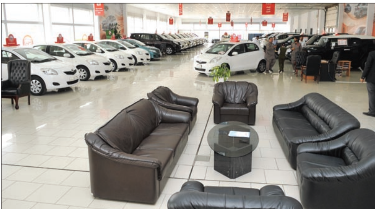
صالة العرض بعد التجديد