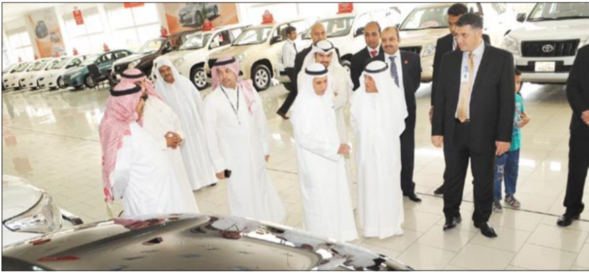
صالة العرض الجديدة تمتاز بمساحة كبيرة