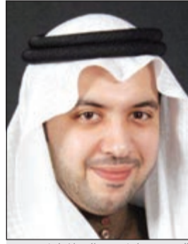
الشيخ مبارك عبدالله المبارك

أكد رئيس مجلس إدارة شركة القرين لصناعة الكيماويات البترولية الشيخ مبارك عبدالله المبارك الصباح متانة استثمارات الشركة وقوة أدائها، والذي سيكون له الأثر المباشر على نتائج الشركة للسنة المالية التي ستنتهي في 31 مارس 2013.