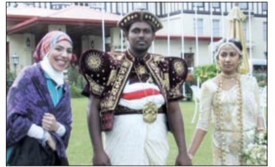
جانب من مسابقات «IWISH»

في الحلقة الثامنة من برنامج IWISH والتي تفصلنا اسبوعين عن الحلقة النهائية من البرنامج، والتي ستعلن فيها النتائج النهائية، سيتمكن الفائز في كل فئة من تحقيق حلمه وإنشاء