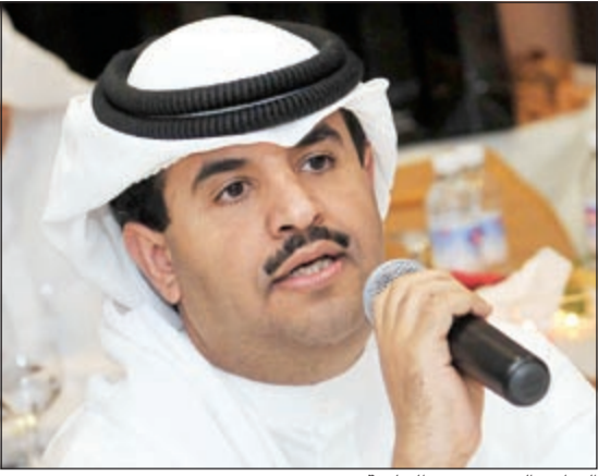
الشاعر الشيخ دعيخ الخليفة