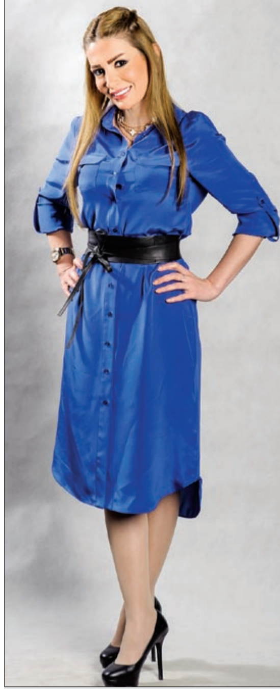
مقدمة البرنامج كليز

وجهت اللبنانية نانسي عجرم الشكر لجمهورها بعدما قام باختيارها لتكون نجمة المفضلة لعام 2013، بحسب استفتاء إذاعة «صوت الغد» اللبنانية. وتحدثت الفنانة اللبنانية، بحسب موقع «جولولي»، عن الزيارة التي جمعت مؤخرا بينها وبين مواطنتها نوال الزغبى، قائلة: إنها أصبحت من صديقتي.