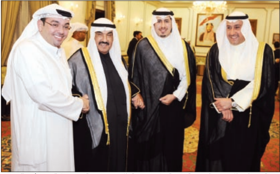
سمو الشيخ ناصر المحمد مرحبا برئيس التحرير الزميل يوسف خالد المرزوق بحضور الشيخ فيصل الحمود وأحمد الحمود