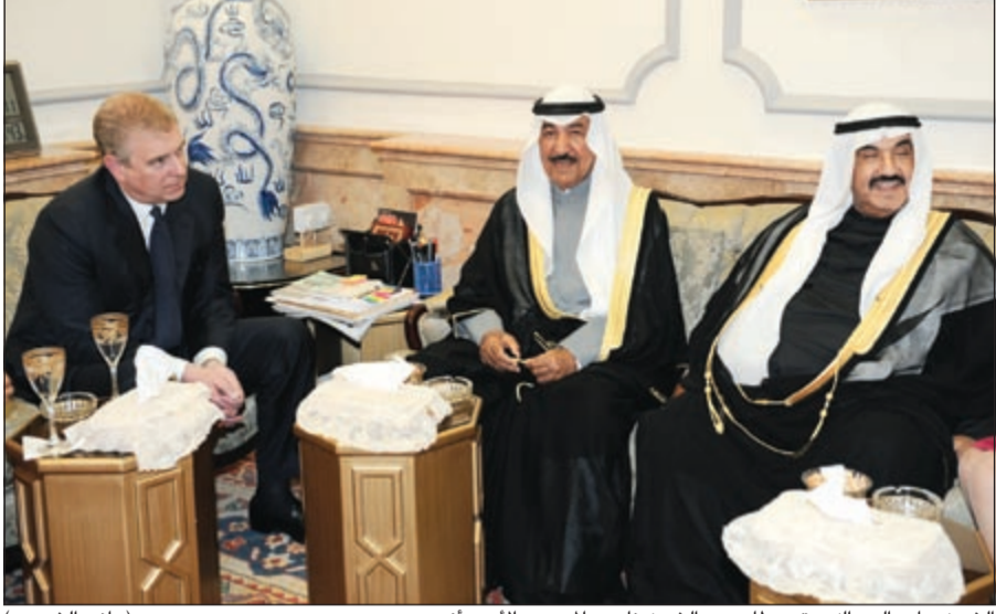
الشيخ جابر العبدالله متوسلا سمو الشيخ ناصر المحمد والأمير أندرو (هاني الشمري)