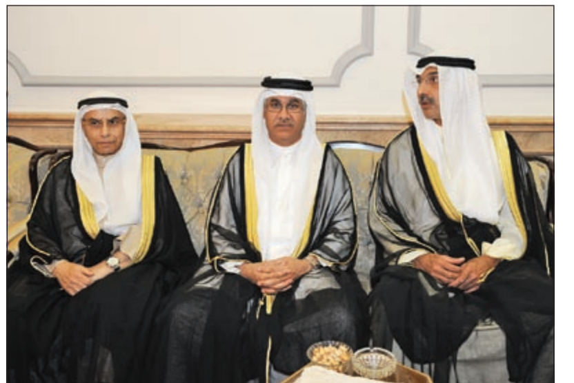
السفير مجدي الظفيري وسفير الإمارات علي بن شكر وم. عبدالرحمن الغنيم