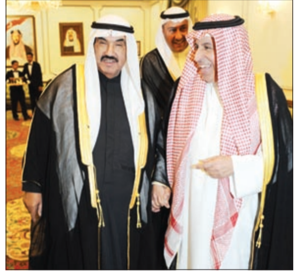
حديث بين سمو الشيخ ناصر المحمد ود. عبدالعزيز الفايذ بحضور الشيخ فيصل الحمود