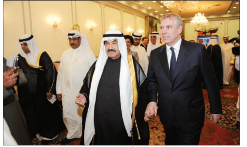
سمو الشيخ ناصر المحمد مستقبلا دوق يورك الأمير أندرو