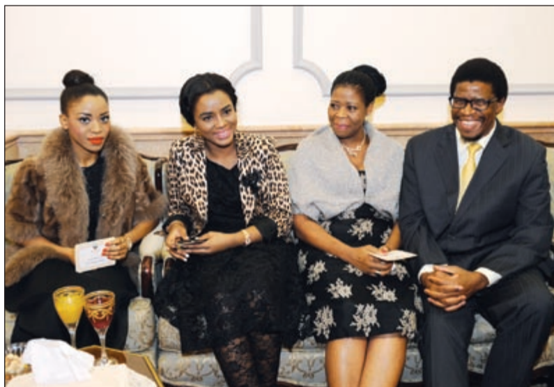
حضور من سفارة سوازيلاند