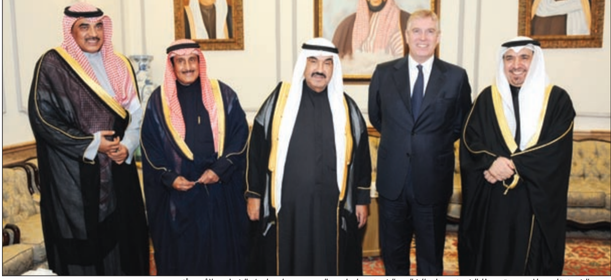
سمو الشيخ ناصر المحمد متوسلا الشيخ صباح الخالد والشيخ د. إبراهيم الدعيج ود. اسماعيل الشطي والأمير أندرو

أقام سمو الشيخ ناصر المحمد حفل عشاء واستقبال على شرف الأمير أندرو دوق يورك بمناسبة زيارته للكويت وذلك تقديرا له وتحسبا للعلاقات التاريخية الوثيقة التي تربط الكويت والمملكة المتحدة. وقد رجب سمو الشيخ ناصر المحمد بضيف الكويت وبالْحُضُور، متمنيا له طيب الإقامة، وحضر الحفل جمع غفير من كبار الشخصيات والشخصيات والإعلاميين. وبدوره، أكد الأمير أندرو رسوخ العلاقات وأواصر الروابط البريطانية-الكويتية في جميع المجالات، معبرا عن سعاداته بهذا الجمع الكريم وتوجه بالشكر لسمو الشيخ ناصر المحمد على هذه المبادرة الطيبة.