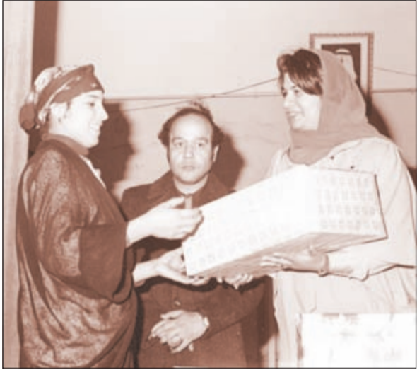
لقطة قديمة للراحلة في جمعية النهضة الأسرية