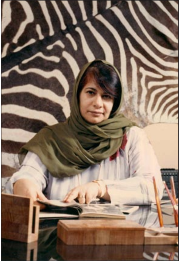
المرزوق رحمها الله في مكتب مجلة سيدتي