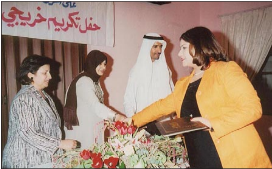
الراحلة في حفل تكريمي مع طالبات جامعة الكويت